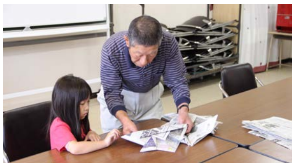
工作コーナー（かぶとづくり）

また軍艦「甲鉄」と館の岬の写真を背景にした撮影コーナーでは、来場者が記念撮影をしていました。