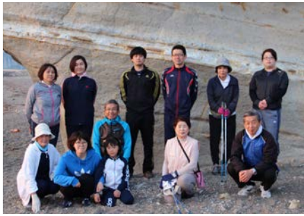
くぐり岩をバックに記念撮影

なお、六月以降も各地区で開催する予定となっております。防災行政無線でご案内いたしますので、町民の皆さんのご参加をお待ちしております。