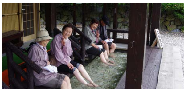
昨年度の高齢者大学町外視察(元和地区)