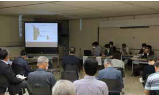
▲函館開発建設部より説明を受ける参加者

当日は、函館開発建設部から岩盤崩壊現場の現在の状況や仮設復旧の進捗状況等についての説明と住民の日常生活への影響等に関して意見交換を行いました。