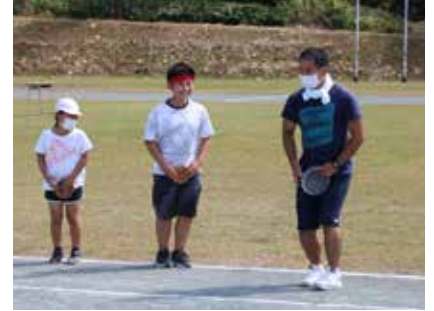
▲笑って笑って疫病退散!