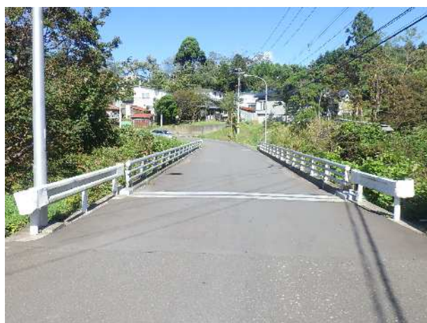
上汐見橋(橋長27.20m) 昭和46年供用開始(49歳)