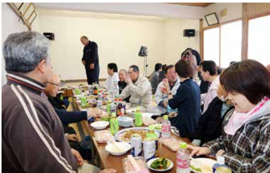
例大祭終了後の懇親会の様子