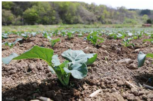
定植されたブロッコリーの苗

今年度は天候に恵まれブロッコリーを始めとした乙部町の野菜が豊作となることを願いながら、美味しい野菜が食べられることを楽しみにしています。