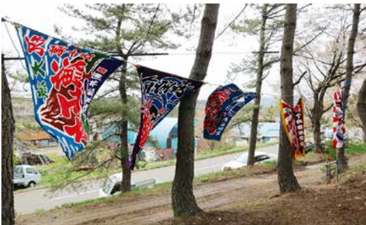
神社に掲げられた大漁旗

竹森(標高百九十三メートル)は、海からその位置が良く確認でき、古くから漁師たちの帰港目標とされ、出船・入船操業の安全に役立ち、大正十三年五月には、国から「航行目標保有林」に指定されま