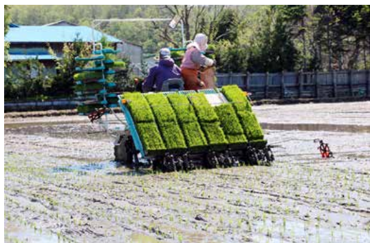
水稲の田植え作業

ブロッコリーの成長の中で最も問題になるのが雨です。雨がずっと一週間ほど畑に入ることが出来ず、作業が止まってしまっほか、低温等の影響で病気になってしまい、売り物にならなくなることもあり、雨が多い年は生産量が伸び悩みます。