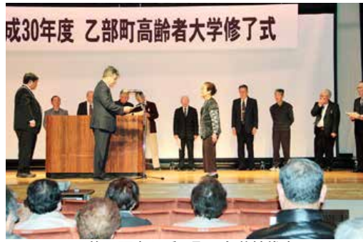
▲修了証書を受け取る各分校代表