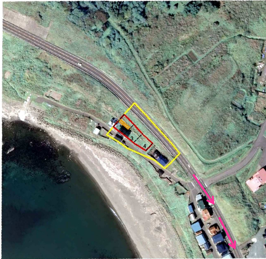
至 栄浜ふれあいセンター

※このマップは、土砂災害危険箇所など、土砂災害のおそれがある場所の調査を行い、土砂災害の警戒が必要な地域を対象に作成したものです。