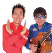
テツ and トモ