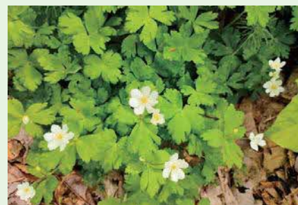
散歩の途中で見つけた小さな癒やし

乙部町に移住してから、季節の移り変わりに敏感になった気がします。ふと足を止めて深呼吸をすると、今まで気づかなかった「季節の匂い」を感じることはありません。雨上がりの土の香りや、潮風に混じる初夏の気配。そんな何気ない瞬間に、自然の豊かさをしみじみと実感しています。忙しく過ぎていく毎日ですが、朝の澄んだ空気の中で聞く鳥の声や、道端に咲