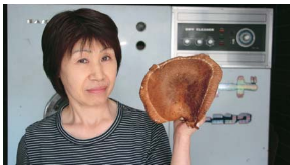
▲グローブみたいなシイタケにびっくり！

奥さんの顔と同じくらいの大さきのシイタケ。このシイタケをどうするかたずねると「そうですね、バター焼きにして食べます」と笑顔で話していました。