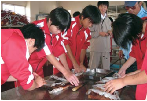
▲真剣にイカをさばく生徒たち

乙部中学校三年生が漁業体験学習として八月二十九日、イカさばきの作業に挑戦しました。