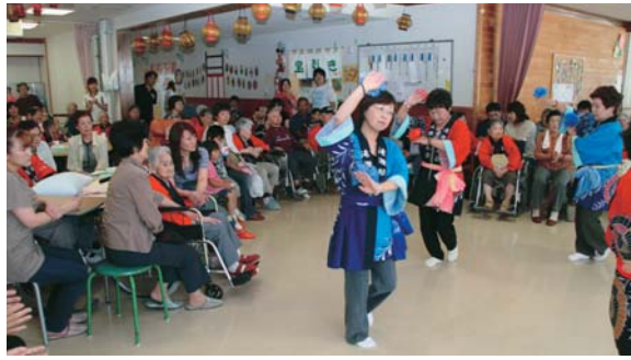
▲余興やゲームを家族と楽しみました

特別養護老人ホームおとべ荘で八月二十三日、おとべ荘夏祭りが開催され、入荘者と家族が一緒に楽しいひとときを過ごしました。