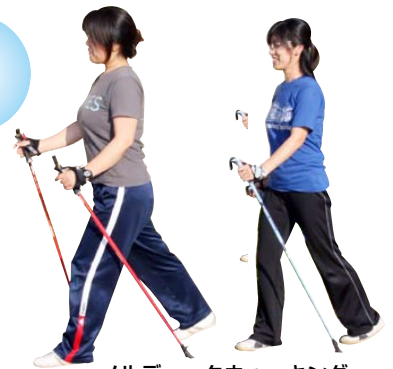
ノルディックウォーキング