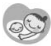
マタニティマーク 妊婦の印です

乙部町では今年4月以降に妊娠届出書を提出した方に、妊婦健診の助成を前期・後期1回ずつの計2回行うことになりました。くわしい内容や、妊娠中や子どもの健康などの相談は役場町民課保健衛生係保健師までお気軽にご連絡ください。