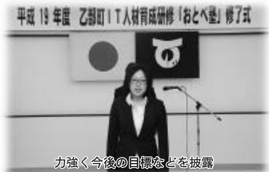
力強く今後の目標などを披露

IT研修「おとべ塾」は四月から二期生を迎え、システム開発などに加え、人間性を育む研修を行い、IT業界の将来を担う技術者を育成します。