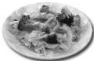
おとべの野菜ヘルシー丼 おとべ賞（乙部町長賞） 乙部中学校ホームエコノミクス部

健康マーク三十回の方や健康遊歩道活用五百回以上の方、虫歯ゼロの子どもたちが表彰され、メニューコンテストでは、地元で取れる食材を使った料理の数々が表彰され、用意されたレシピ集も好評でした。