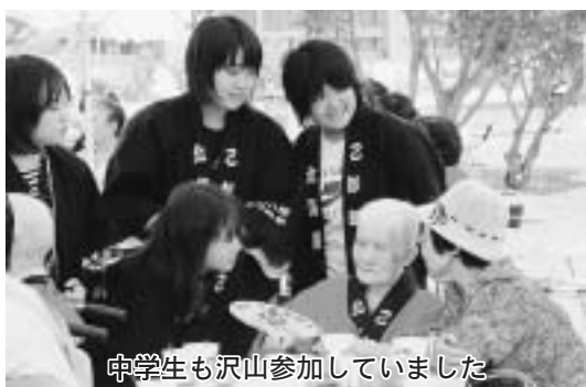
中学生も沢山参加していました

案し、趣向を凝らした各種ゲー ムや余興、盆踊りなどが行わ れ、大盛況のもと、皆さん楽 しい一日を満喫しました。 おとべ荘の梁田施設長は、 「今回で三回目になります、 回を重ねるたびに家族やボラ ンティアの参加者が増え、企 画する側も大変喜んでいます。」 と話していました。