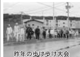
昨年の歩け歩け大会

〈備考〉 ○都合により変更することがありますが、あらかじめご了承ください。 ○未定行事については後日、広報等でお知らせいたします。