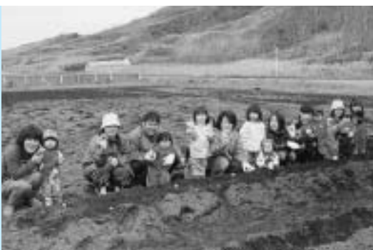
※写真はひよこサークルで、いも植え後の記念撮影。10月には収穫祭を予定しています。

乙部町では、出生届け出時及び年度初めには、該当者に個別にご案内しております。各事業への参加をご希望される方で、案内が届いていない方がおりましたら役場町民課保健衛生係（電話62-2311・保健師）までご連絡ください。