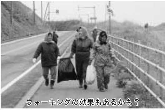
ウォーキングの効果もあるかも?

だけゴミを拾ったかだけではなく、どれだけ捨てられているゴミが減ったかにも目を向けて、「拾うより捨てない」という意識が浸透すると、ゴミを捨てる人が減り、クリーン