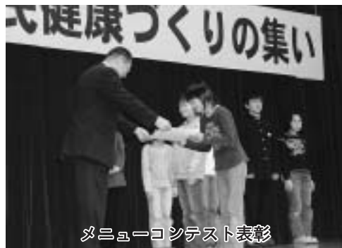
メニューコンテスト表彰

また、町内の小・中学生を対象に実施した「元氣いっぱい夢いっぱいメニューコンテスト」の受賞者の表彰も行われました。