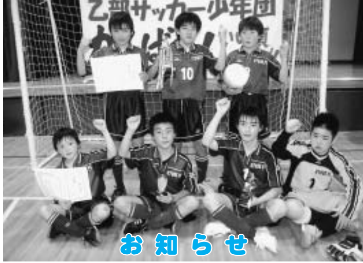
第9回大村病院杯室内サッカー大会で優勝した乙部サッカー少年団