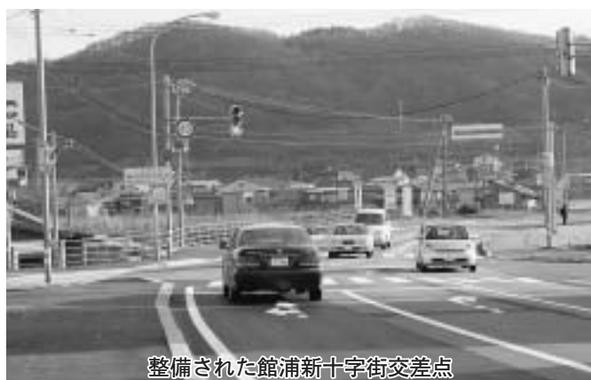
整備された館浦新十字街交差点

昨年秋頃から函館開発建設部江差道路事務所により整備が進められていた、国道館浦新函館農協ガソリンスタンド交差点の右折車線帯がこのほど完成し、光林荘及び乙部漁港方面行きの右折、直進車の走行がスムーズになりました。