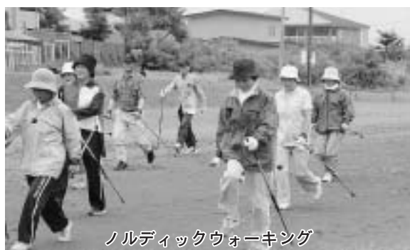
ノルディックウォーキング

きいことがわかりました。そこで、推奨されているのがノルディックウォーキングです。ノルディックウォーキングはフィンランド生れのスポーツで、2本のポール（ストック）を使うウォーキングです。ポールを使うことで下半身だけでなく、腕や肩など上半身を含めた身体全体の運動となります。年齢や性別を問わず誰にでもできる新しいタイプのスポーツです。ウォーキングの習慣のある方、試してみませんか？お問合せは役場保健師（電話62-2331）まで