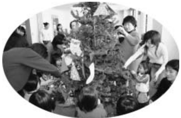
★今年の飾りつけ 素敵でしょう？★