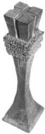
受賞者に贈られた 乙部町民表彰ブロンズ