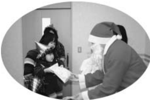
★サンタさんからクリスマスプレゼント★