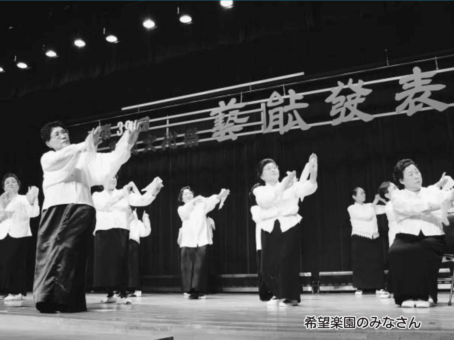
希望楽園のみなさん