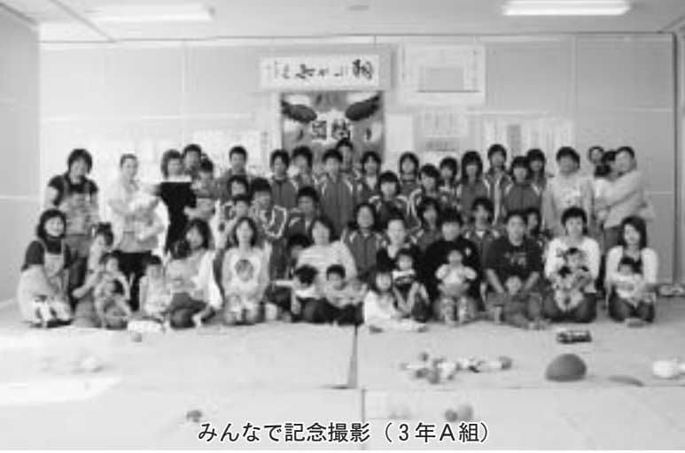
みんなで記念撮影（3年A組）