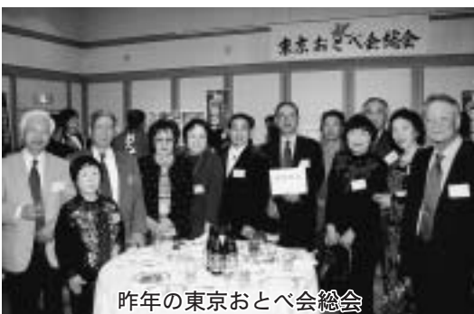
昨年の東京おとべ会総会