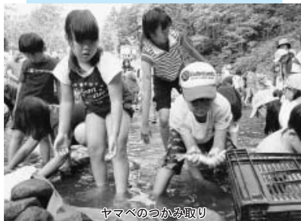
ヤマベのつかみ取り