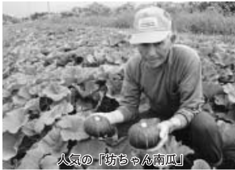
人気の「坊ちゃん南瓜」

坊ちゃん南瓜は、一個五百 グラム位の小玉で、電子レンジ 五〜八分で手軽に食すること ができるため、最近では急激 に人気が増え、家庭菜園でも よく作られています。九月中 旬まで収穫し、約二万五千玉 を出荷する予定となっています。