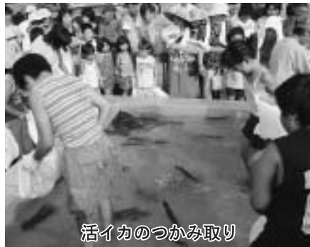
活イカのつかみ取り