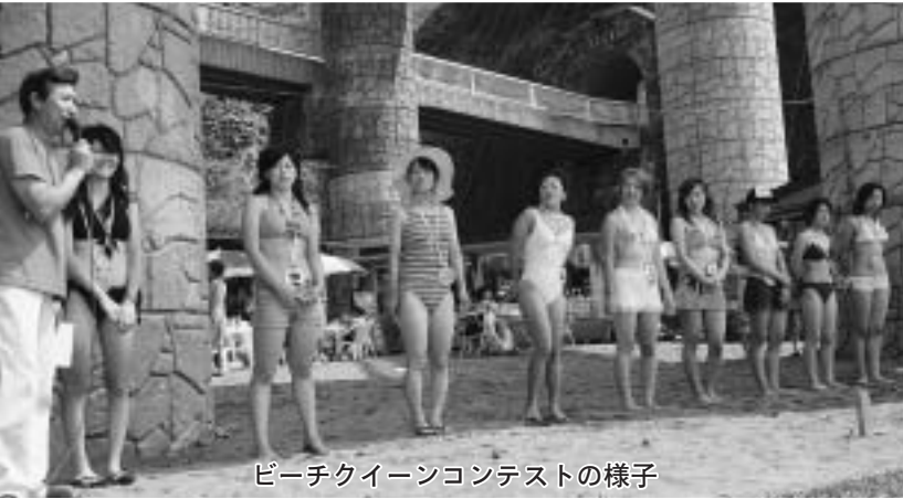
ビーチクイーンコンテストの様子

このほか、まつりのメインイベントのビーチクイーン（水着）コンテストには、札幌や函館、遠くは神戸市などから訪れた観光客12人が参加。いずれも個性を生かした水着と一芸を披露して審査委員にアピール。見物客からは歓声が上がっていました。