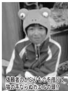
依頼者のかぶりものを借りて猫の手ならぬカエル頭!?

ランティアの生徒十八人が、夏休み中の福祉活動の一環として「猫の手計画」を立て、町内でボランティア活動を行いました。当日は、事前に依頼のあった二軒のお宅へ伺い、窓拭きや手の届かない高い所の掃除、お盆の買い物などのお手伝いを行いました。生徒たちは、汗だくになりながらも持ち前の若さで次々と作業を終え、依頼したお年