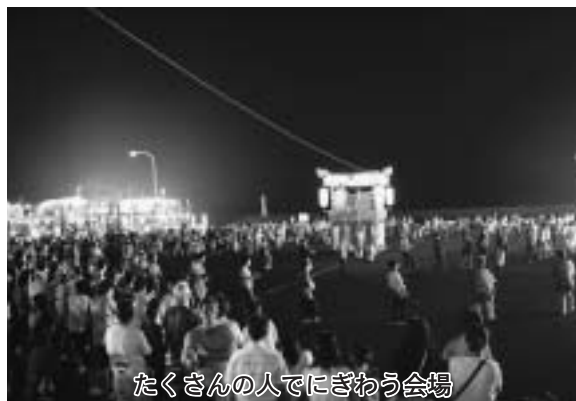
たくさんの人でにぎわう会場

八月十四日、第十八回ふれあい交流盆おどり・花火大会が乙部漁港中央埠頭で開催され、お盆の帰省客や町民など二千人以上が参加し、夏の一夜を楽しみました。埠頭周辺を囲んだイカ釣り漁船のいさり火が会場をライトアップする中、宵宮祭を終えた本町各地区の山車五台も会場に集結。祭ばやしに大鼓、華やかな電飾で会場のお祭りムードを盛り上げました。