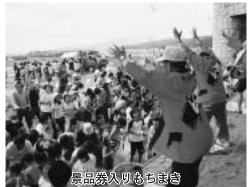
景品券入りもちまき