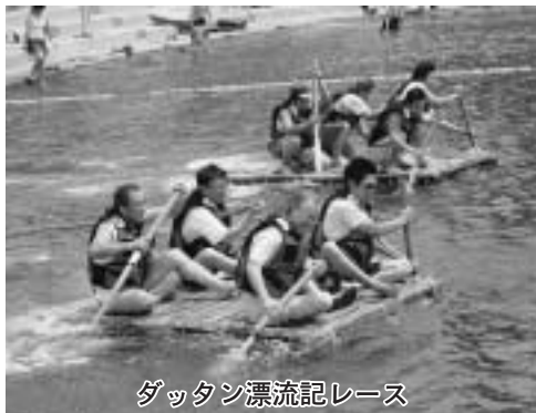
ダットン漂流記レース

フェスティバルの締めくくりの景品券入りもちまきでは、両手に持ちきれないほど拾い、たくさん景品を手に入っていた人も、ゲームにイベントに盛り上がった一日となりました。