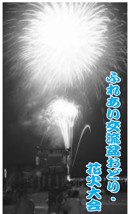
ふれあい交流盆おどり・ 花火大会

八月十四日、第十八回ふれあい交流盆おどり・花火大会が乙部漁港中央埠頭で開催され、お盆の帰省客や町民など二千人以上が参加し、夏の一夜を楽しみました。埠頭周辺を囲んだイカ釣り漁船のいさり火が会場をライトアップする中、宵宮祭を終えた本町各地区の山車五台も会場に集結。祭ばやしに大鼓、華やかな電飾で会場のお祭りムードを盛り上げました。