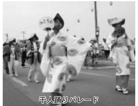
千人踊りパレード

八月十四日、第十八回ふれあい交流盆おどり・花火大会が乙部漁港中央埠頭で開催され、お盆の帰省客や町民など二千人以上が参加し、夏の一夜を楽しみました。埠頭周辺を囲んだイカ釣り漁船のいさり火が会場をライトアップする中、宵宮祭を終えた本町各地区の山車五台も会場に集結。祭ばやしに大鼓、華やかな電飾で会場のお祭りムードを盛り上げました。