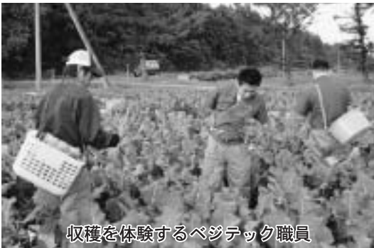
収穫を体験するベジテック職員

ベジテックでは、この体験 研修が消費者との掛け橋となっ ている職員の貴重な経験とな り、生産地でも活かされるも のと、来年以降も継続して行 うことにしています。