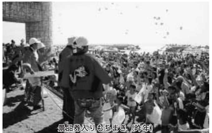
景品券入りもちまき (昨年)

※元和台マリンフェスティバル事務局では、実行委員としてご協力いただける方を募集しています。