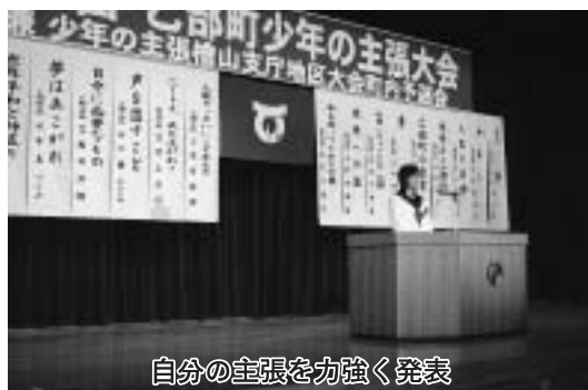
自分の主張を力強く発表

もらった手紙によって励まされ、プラス思考に考えるようになった。今度は自分が出来ることで、みんなに恩返しをしたい。」と力強く主張しました。