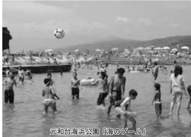
元和台海浜公園「海のプール」

これは、平成十三年に同公園が選定された「日本の水浴場八十八選」の選定基準が三年ぶりに見直され、新たに水浴場の選定が行われた