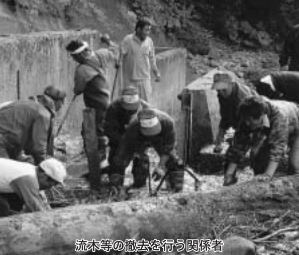
流木等の撤去を行う関係者

これは、流木等によってサクラマス等の遡上の通り道である魚道がふさがれているために行われたもので、関係者らは遡上を願い、流木等の撤去で汗を流していました。