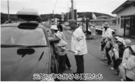
元気に声を掛ける園児たち