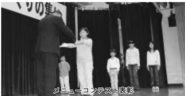
メニューコンテスト表彰