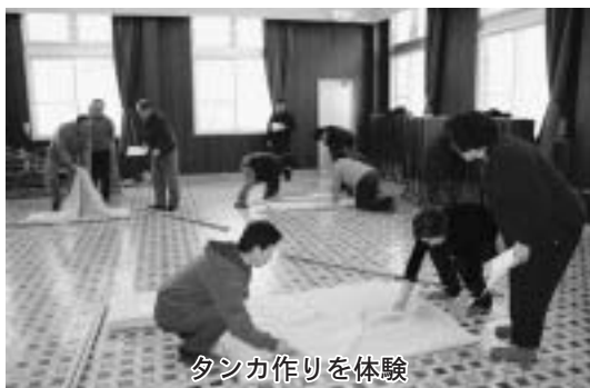
タンカ作りを体験