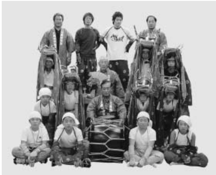
豊浜三鹿獅子舞保存会

三鹿獅子舞は、安永年間（1772～81）に豊浜に伝わり、地域生活の中に溶け込み伝統文化として発展したが、生活・文化の多様化に伴い、伝承活動が困難となったことから、昭和四十三年に保存会を結成し小学校での後継者育成活動や衣装保存事業、