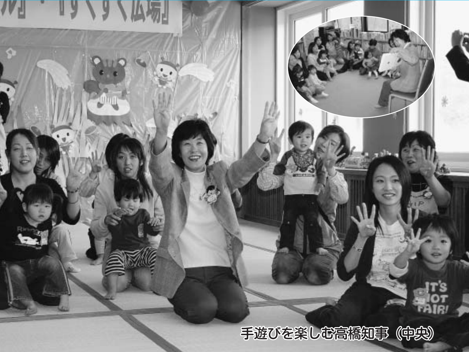
手遊びを楽しむ高橋知事（中央）