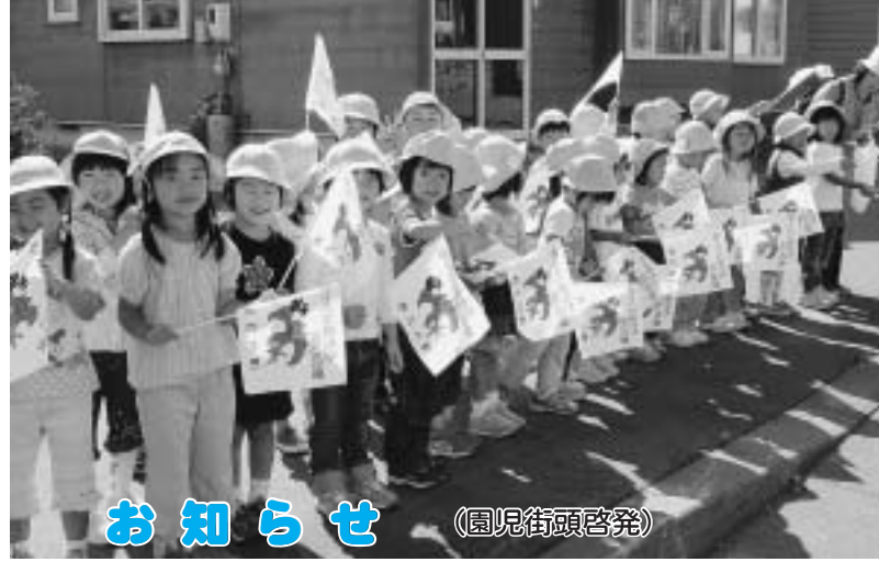
お知らせ (園児街頭啓発)