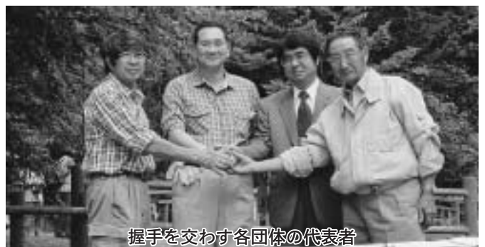
握手を交わす各団体の代表者