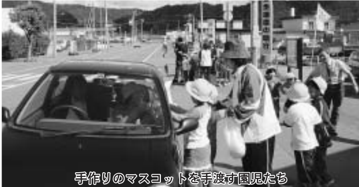
手作りのマスコットを手渡す園児たち