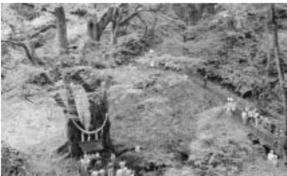
多くの人で賑わう会場

この協定は、小茂内川、来拝川流域の国有林二百八十一畝、町有林二百二十四畝の合計五百五畝の森林を対象として、森林の保全、保護育成や体験学習活動などを展開することを目的としたもので、森林保有者である国（檜山森林管理署）と町のほか、町内で森づくり活動を展開している魚つきの森づくり協議会と乙部町縁桂を保全する会の二団体が加わり、四者で締結。