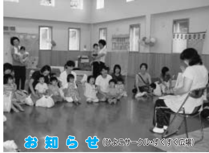
お知らせ (ひよこサークル・すくすく広場)