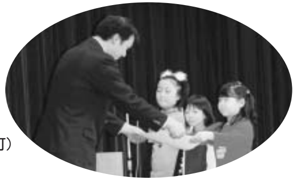
昨年度の表彰式の様子

元気いっぱい・夢いっぱいメニューコンテストは、 子ども達へ食べることの楽しさを知ってもらいたい、 乙部町で採れる農水産物をもっと知ってもらいたい との気持ちから始まったコンテストです。