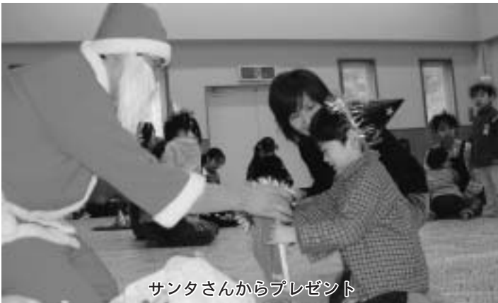
サンタさんからプレゼント