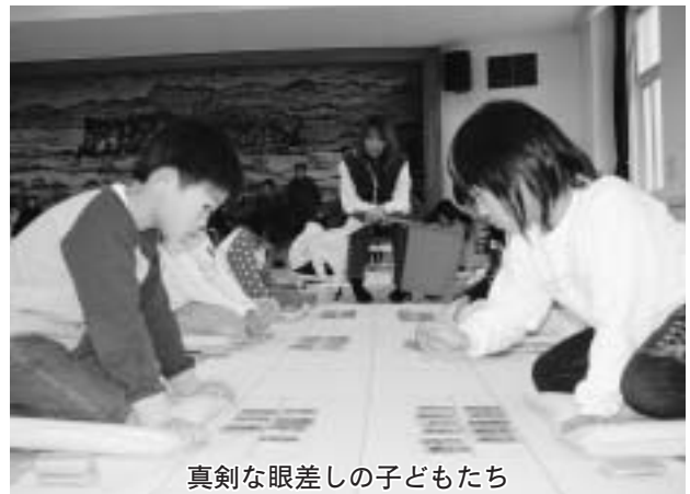
真剣な眼差しの子どもたち