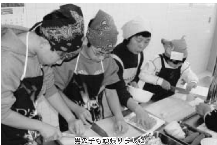
男の子も頑張りました

できあがった料理をみんなで試食し「初めてヤーコンを食べただけおいしかった。きらいだったものも食べられるようになった」などと感想を話し、自分でつくった料理の味はやはり格別だったようです。