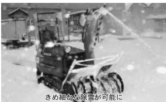
きめ細かな除雪が可能に

この事業は、同センターが全国宝くじ普及広報事業費として受け入れる宝くじ受託事業収入を財源に、住民の行うコミュニティ活動の促進を図るとともに、宝くじの普及広