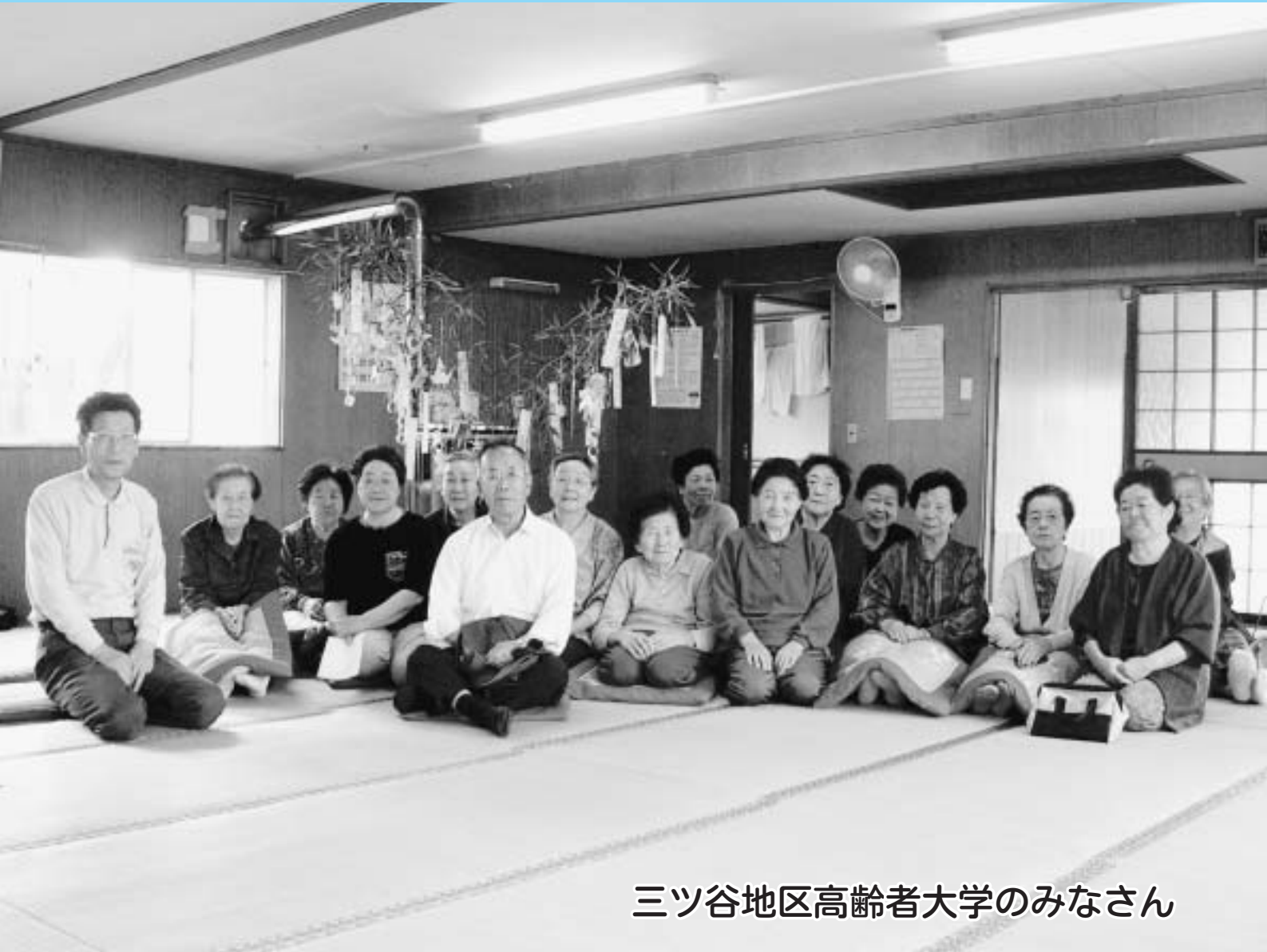
三ツ谷地区高齢者大学のみなさん