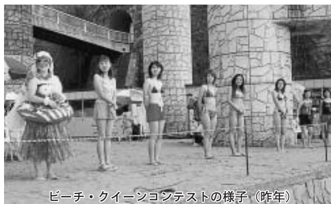
ビーチ・クイーンコンテストの様子(昨年)