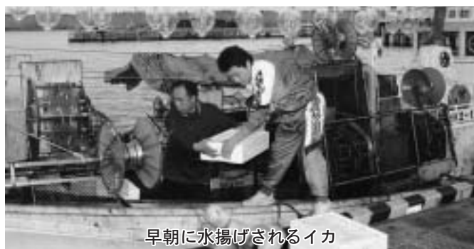
早朝に水揚げされるイカ