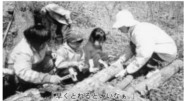
「早くとれるといいなあ。」