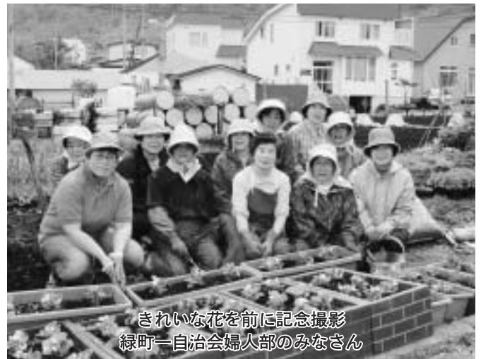
きれいな花を前に記念撮影 緑町一自治会婦人部のみなさん

今後は、町花のユリが7月ごろには咲くことになっており、同自治会では秋まで花いっぱい運動に取り組むことにしています。