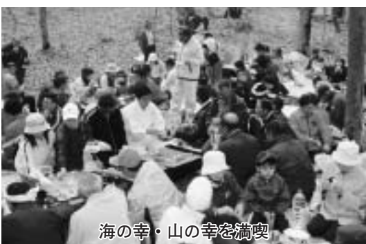
海の幸・山の幸を満喫