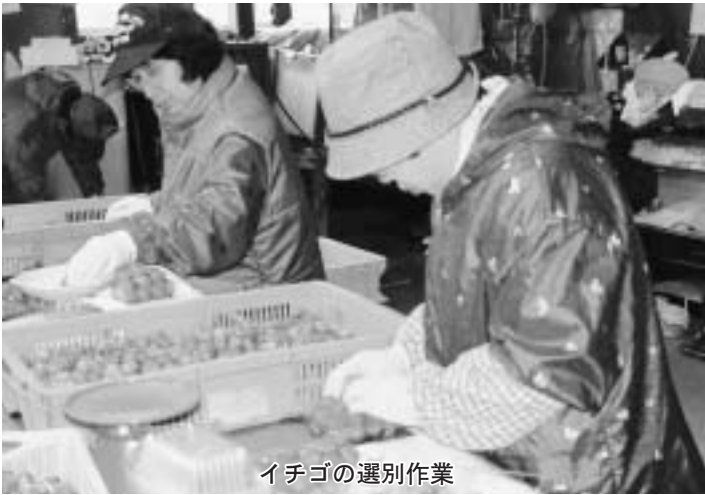
イチゴの選別作業

五月下旬には出荷がピークをむかえ、収穫作業は、パート主婦らが真っ赤に熟したイチゴを一つひとつ丁寧に摘む作業。温度管理やこまめな手入れで品質の良さが売り物で市場でも高い評価を受けています。