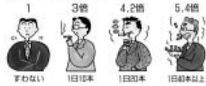
タバコと肺がんの関係