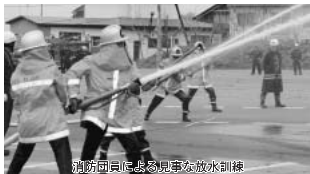
消防団員による見事な放水訓練

各分団ごとに小隊訓練やポンプ車操作、さらに実際に水を放す放水訓練も本番さながらに行われ、消防団員の頼もしい姿に来賓の方々からは拍手が送られていました。