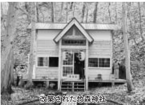
改築された竹森神社