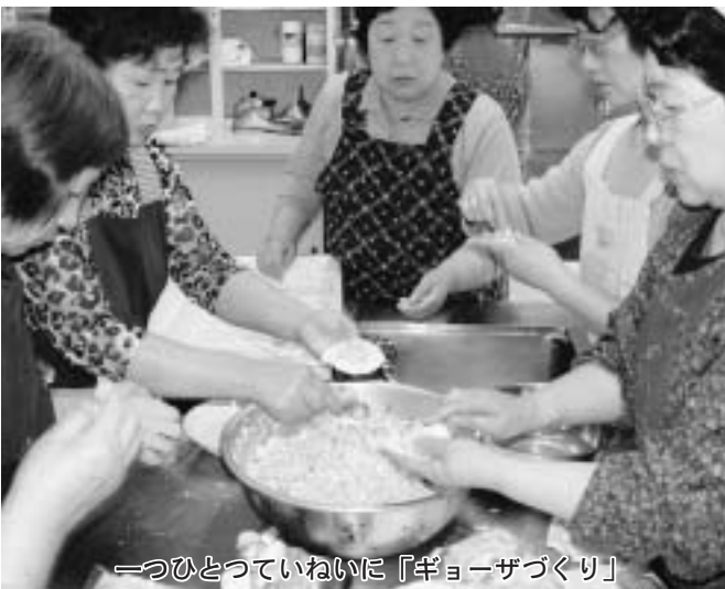
つみとつていねいに『ギョーザづくり』

体操の参加者は「体がぼかぼかする、気持ちいいね。」と話し、食べて、運動して健康的な一日となったようです。