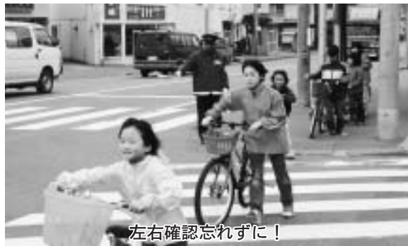
左右確認忘れずに！

にあたり、「そこで左右確認して車が来ないかどうか確認するんだよ」などと児童一人ひとりに声をかけていました。 また、今年入学した一年生は、先生に引率され歩道のない道路の歩き方や交差点の渡り方など念入りに指導されていました。 児童たちも、普段は何気なく通る道路にも様々な危険があることをあらためて知り、真剣な表情で指導を受けていました。