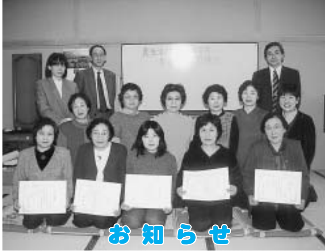
(乙部町食生活改善推進員養成講座修了式)