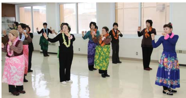
▲衣装もばっちりのフラダンス教室