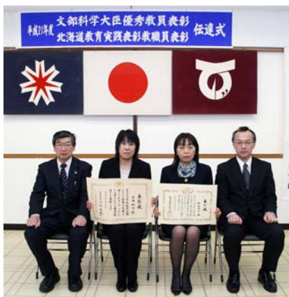
▲受賞を喜ぶ両教諭

また、理科や家庭科、道徳などの教科と連携するとともに、外部人材を活用した思春期保健講話や赤ちゃんふれあい教室などを実施し、その取り組みが認められました。