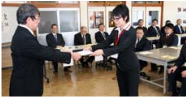
▲今後の活躍が期待されます

かな人間性を持つことを目指してきた。これからもますます努力して欲しい」などと式辞を述べました。