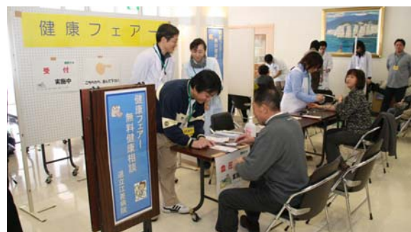
▲健康相談コーナーも盛況

講演終了後は、体力づくり実践教室として、健康体操とフラダンス教室が行われました。