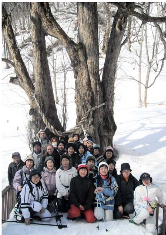
▲縁桂の前で記念撮影

昼には、かぼちゃぜんざいなどを食べ、体の芯から温まり、冬山の楽しさを新たに感じていました。