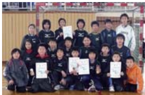
▲元氣いっぱいサッカー少年団

トサル大会では、U-12（十才以下）で三位に入る健闘。U-10（十才以下）では、見事優勝を飾りました。