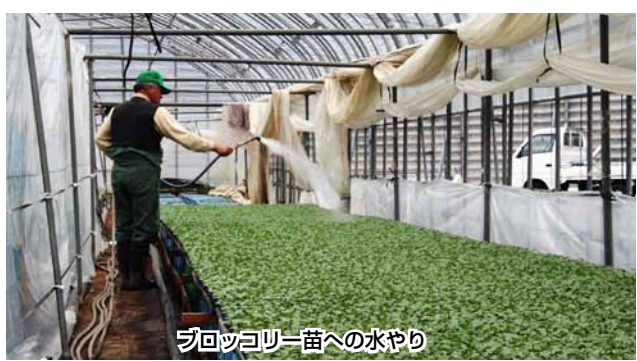
ブロッコリー苗への水やり