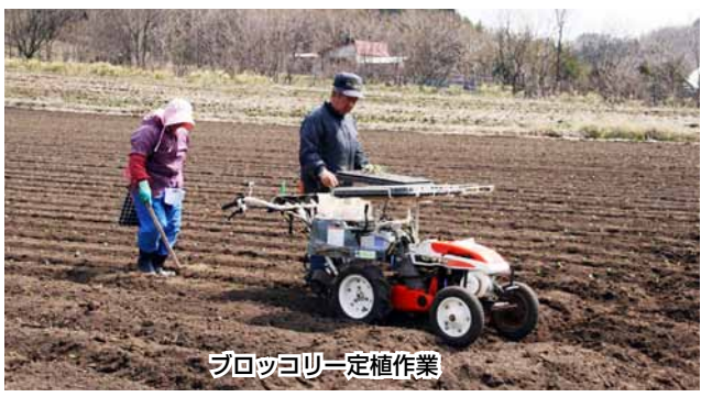
ブロッコリー定植作業