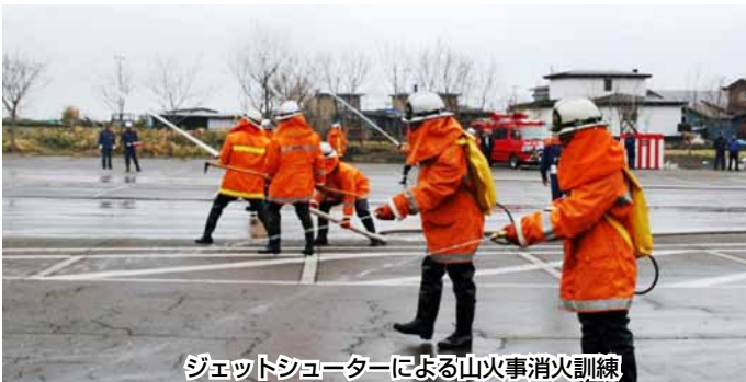
ジェットシューターによる山火事消火訓練