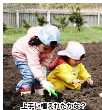
上手に植えたかな？

今年は少し風が強かったものの天候に恵まれ、園児たちは元気いっぱいジャガイモを植えていました。