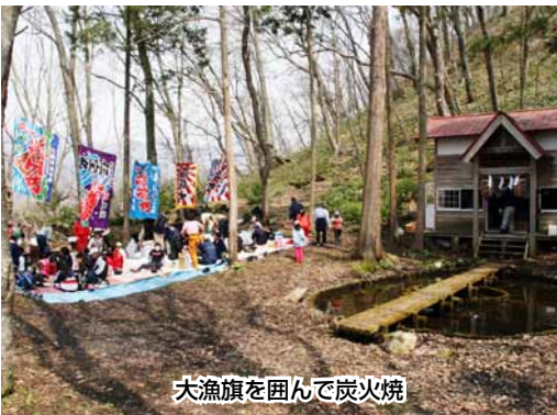
大漁旗を囲んで炭火焼

神事が執り行われた神社の周りには大漁旗が掲げられ、例大祭終了後には地元で取れた海の幸や山の幸を炭火焼にし、参加者らは舌鼓をうっていました。