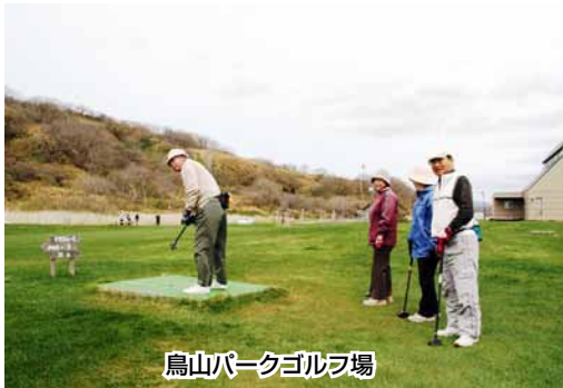
鳥山パークゴルフ場

でを予定しており、時間は九 時から十七時（六月と七月は 十八時まで）で、料金は大人 一名二百円、小人一名百円。 道具の貸し出しも行っていま す。