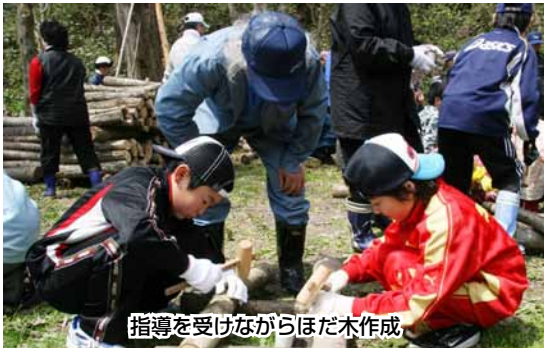
指導を受けながらほだ木作成

参加者らは急斜面にある植樹場で、地面へ穴を掘り、一本一本ていねいに木を植えていました。