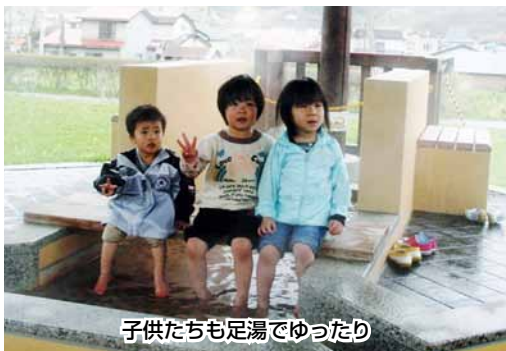
子供たちも足湯でゆったり

なお施設は無料で使用でき ます。利用時間は十時から 十七時までとなります。（月曜 日・祝日は定休日となります。）