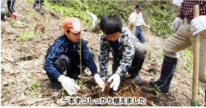
一本ずつしっかり植えました