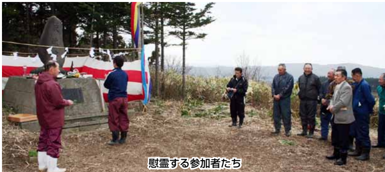
慰霊する参加者たち