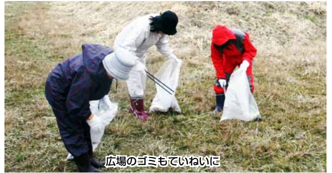
広場のゴミもていねいに