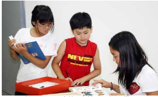
図鑑でチョウの名前を真剣にさがす子供たち

ビニール製のテープで固定。そのまま二週間乾燥させて、八月十一日にてんし板から標本箱に移動させました。標本箱にチョウを配置した後、子どもたちは図鑑でチョウの名前を調べ、ラベルをそれぞれのチョウに付けていきました。子どもたちは真剣に図鑑を見入って、チョウの名前を見つけるとうれしそうな顔をしていました。