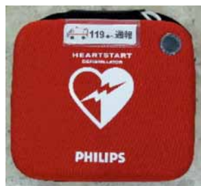
AED(自動体外式除細動器) 町内の小中学校、保育園、体育館、公民館、いこいの湯、海浜公園、消防などに設置されています