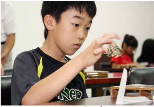
チョウをてんし板に乗せる

七月二十八日はあいにくの天気で、子どもたちが楽しみにしていた昆虫採集は中止となってしまうましたが、標本作りは事前に用意されたチョウを使用して行われました。チョウはてんし板と呼ばれる板に一匹ずつ丁寧に置かれ、てんしテープと呼ばれる