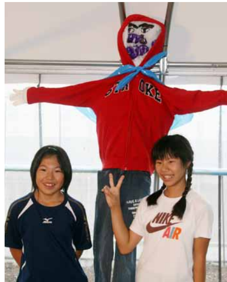
個性豊かなかかしが完成

かかしは木の角材で骨格を作り、ビニール袋に入れられたもみ殻を括りつけることで体や頭を作成され、ど