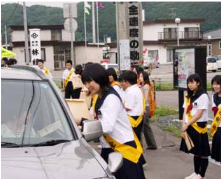
交通安全を車1台ずつに呼びかけ

夏の全国交通安全運動に伴う街頭啓発が七月二十日、乙部中学校前で実施され、乙部中学校一年生ら三十六名が参加し交通安全を訴えました。