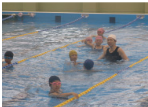
◀水泳を習う子ども達