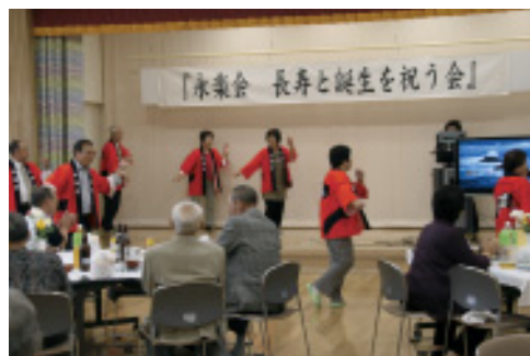
の笑顔がひろがっていました。