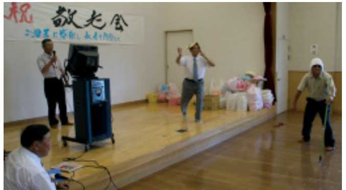
姫川・旭岱・千岱野三地区敬老会余興