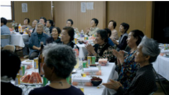
三ツ谷地区敬老会