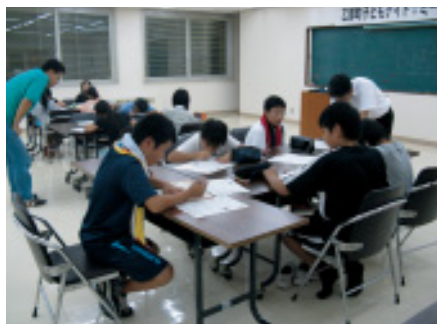
放課後学習も真剣に取り組めます

達のことは全て自分達で取り組んでいきました。夜のプログラムでは、自分が一番好きなことを友達と話し合ったり、夜の公民館を探検したりと楽しみ、翌朝には元気に学校に登校していく姿が見られていました。研修の最後には、学んだことを生かし、これからは学校から帰ったら家庭学習や家の手伝いをしっかりやっけていきたいと感想が寄せられていました。