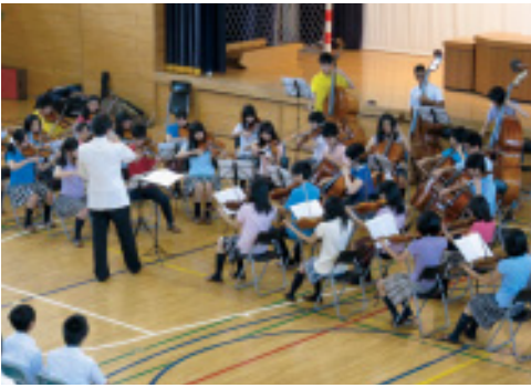
▲玉川学園オーケストラ部

八月二十五日、乙部中学校と乙部小学校の二会場で、玉川学園オーケストラ部（東京都）による学校演奏会が開催され、町内の全小中学生がオーケストラの演奏を鑑賞しました。この演奏会は玉川学園中・高等部の協力のもと、音楽の良さを互いに感じ、人と人が交流することを目的に開催。バイオリンやチェロなど四種