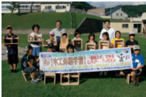
イスと本棚を作った木工体験学習

八月二十八日から三十日まで、町民会館を会場に二泊三日の「子どもナイト☆ミーティング」が開催されました。この事業は、いつも通り学校に通いながら様々な研修プログラムを通して、子ども達の規則正しい生活習慣と学習習慣の形成を目的に実施。乙部の地層探検や木工体験学習を始め、放課後学習や夕食作りなど、仲間と協力しながら自分