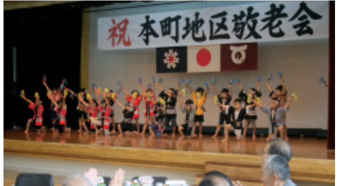
園児による踊り披露