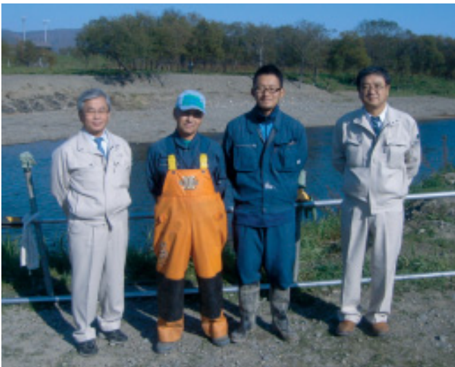
(社)十勝釧路管内さけます増殖事業協会 (幕別町)