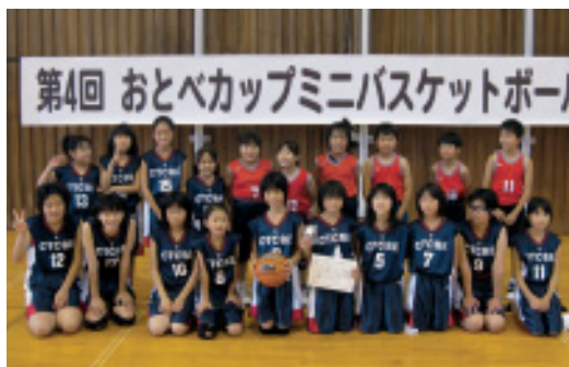
乙部ミニバスケットボール少年団