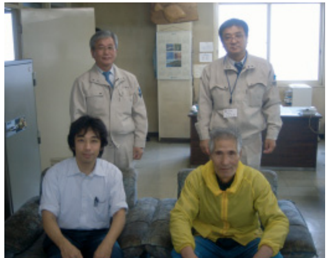
(株)吉岡水産 (紋別市)

町と出稼援護相談所では毎年、ふるさとを離れて就労している方々の事業所を訪問し、就労先の実態把握、出稼ぎ者の激励、さらには労働条件の向上等を図るため、出稼先現地訪問を実施しています。 今年度は十二事業所、二十五人を訪問いたしました。 出稼ぎのみなさんにとって も元気に働いています。 お忙しい中ご対応いただき ました各事業所・出稼ぎ 者の方々に感謝申し上げます。