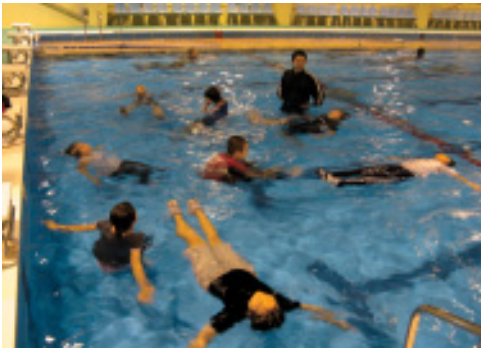
▲着衣泳を体験する子ども達

十月十日、町民プールにおいて、プールの閉館日に合わせて着衣泳体験会が開催され、水泳少年団の小中学生や父母等が参加し、水の事故から自分の生命を守る知識と技術を学びました。体験会では、服を着たまま着水した時の感覚の体験をはじめ、着衣のまま体を浮かばせる方法や着衣での泳ぎ方など、事故防止のため