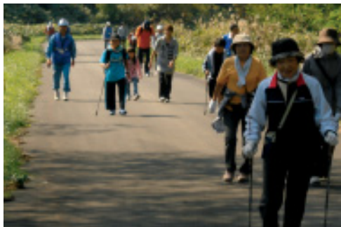
豊かな自然の中を歩く参加者

当日は、日差しも注ぐ絶好のウォーキング日和で、町民体育館前を出発し、姫川方面と宮の森公園を歩く距離や難易度の異なる三コースに分かれて歩きました。幼児からお年寄りまでの参加者は、自分