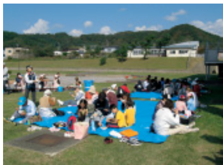
歩いた後は鮭汁を堪能しました

の体力に合わせてコースを選び、豊かな自然の中で楽しく会話を弾ませながら歩いていました。また、今年もノルディックウォーキングポールの貸出しがあり、体育指導委員などから丁寧な手ほどきを受ける姿が見られていました。昼食では、食生活改善推進委員会の協力による地産地消の鮭汁がふるまわれ、参加者は舌鼓を打ち、スポーツの秋を満喫していました。