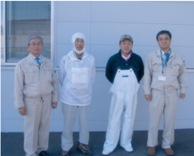
大樹漁業協同組合 (大樹町)