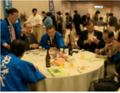
乙部の特産品試食会とアンケート