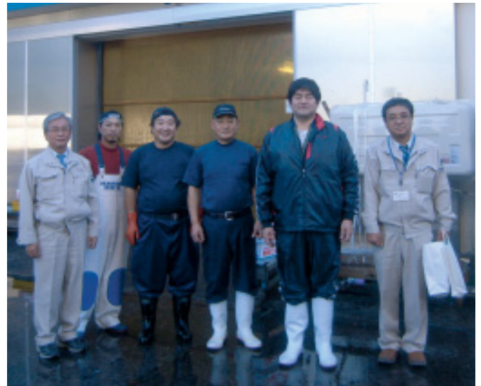
(株)山本水産 (広尾町)