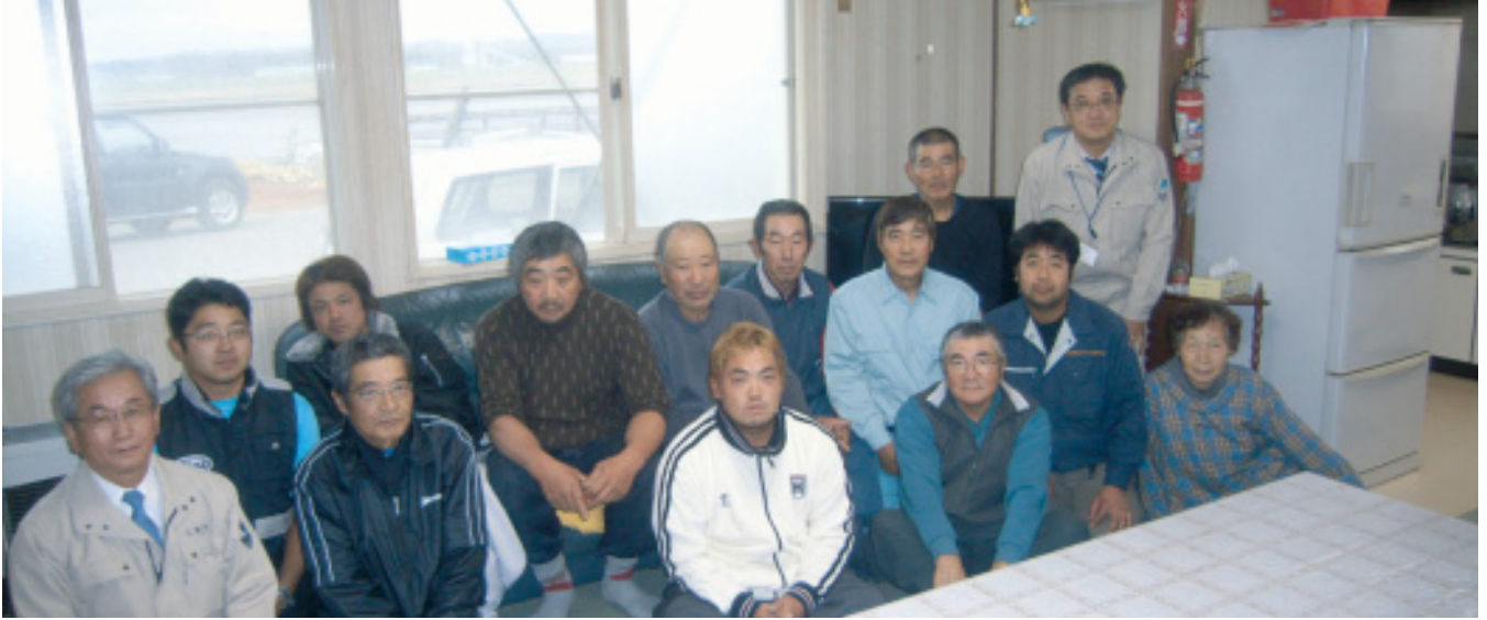
(社)さけます増協 (天塩町)