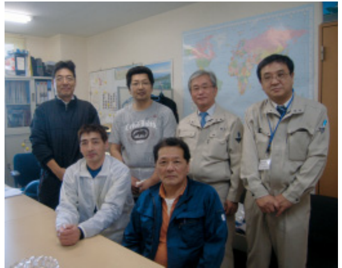
(株)東邦物産 (紋別市)