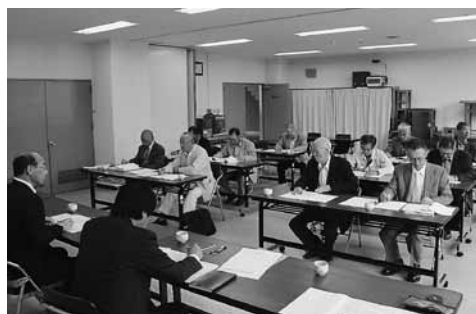
開設連絡会議の様子

五月九日、公民館において高齢者大学開設準備連絡会議が開催され、町内十地区の老人クラブ会長や役員などが出席し、今年の高齢者大学開設の内容及び日程などについて話し合われました。 会議では、出席者から教養を高める文化講座の開催や、老いに備える老人施設や学習講座の開催などの提案のほか、各地区の講座で工夫して開設している点などについての情報交流も行われました。 教育委員会と公民館では、今年も高齢者の皆さまが明るく元気に生きがいをもって毎日を過ごされることを願い、全地区合同や各地区高齢者大学において郷土料理教室や映画鑑賞、視察研修など様々な講座を予定していますので、ぜひ出席して皆さんと一緒に楽しく過ごされてはいかがでしょうか。