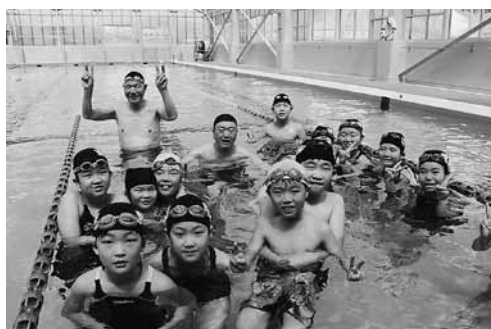
久しぶりに水の感触を楽しみました