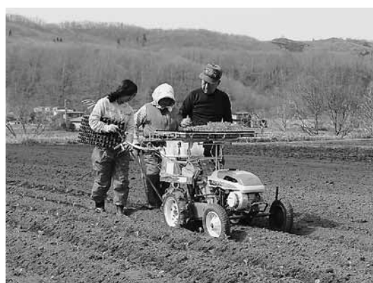
ブロッコリーの定植

をこれからの就農者に理解していただいて、夢のある農業経営を続ける担い手が多く現れることが期待されています。