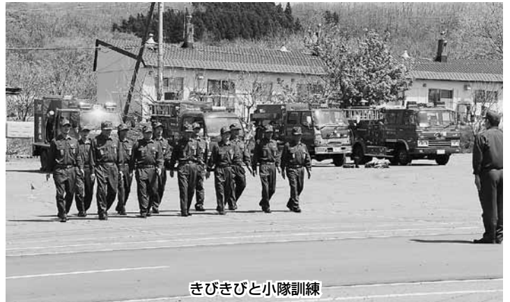
きびきびと小隊訓練