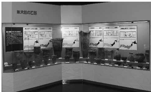
公民館郷土資料室