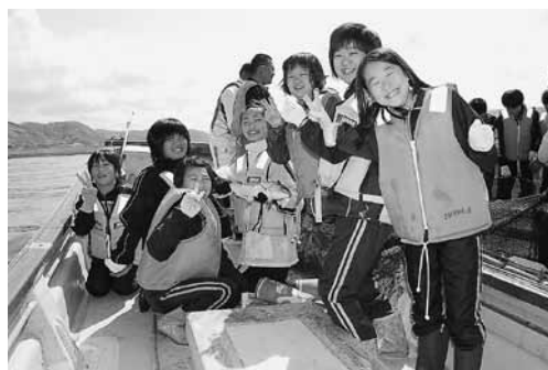
獲れた魚に歓声を上げる児童

コなどが水揚げされると児童は大きな歓声を上げ喜んでいました。その後、漁師さんの計らいで周辺を遊覧し、普段見ることのできない、海からの街並みを望むこともできました。帰港した後は、乙部で力を入れているナマコの養殖施設を見学し、児童は乙部の基幹産業についての理解を深めていました。ご協力ありがとうございました。