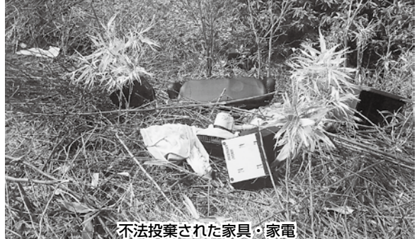
不法投棄された家具・家電