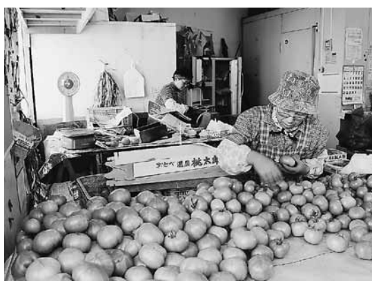
トマトの選別・箱づめ

これからの目標は、既存の作物の収益性を確保し、気候の変化に対応できる作物を定着していくこと。さらに、主要な作物を増やし、輪作体系を確立することで連作障害を回避し、収量の増加と品質を高いレベルで維持することを目指しています。こうすることで、長期にわたって農業の安定経営ができるということです。