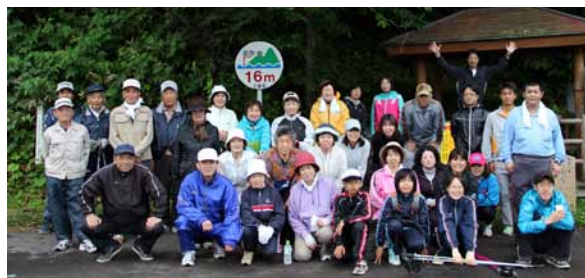
◀六月のウォーキング講座