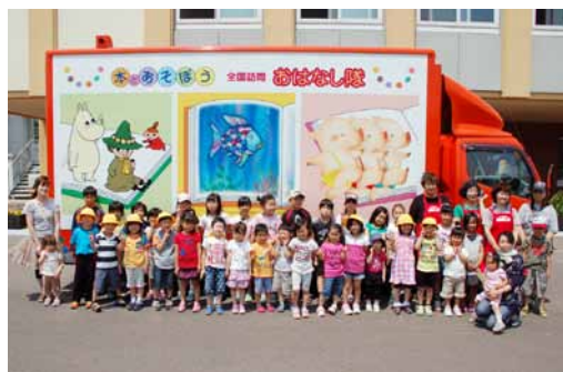
おはなし隊キャラバンカーと一緒に

当日は、幼児から小学生とその保護者等六十名が参加し、子ども達はキャラバンカーに乗って好きな本を自由に選び、楽しんで読んでいるようでした。また、読み聞かせでは、おはなし隊長と館浦婦人会読み聞かせの会が交互に六冊の絵本や紙芝居を読み聞かせ、会場には時おり笑い声も交じり、絵本と触れ合う充実したひと時を過ごすことができました。