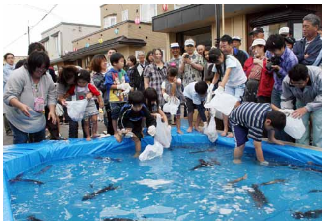
▲昨年の活イカつかみ取り

踊りがわからない、自信がないという人のために、事前に練習する機会を設けますので、ぜひ参加してください。