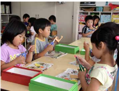
▶園児も一生懸命作りました