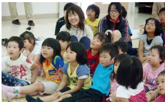
おはなし会は笑い声で包まれました

六月三十日、絵本に親しむ態度を養うことを目的に、町民会館に「本とあそぼう」全国訪問おはなし隊」を招き、絵本や大型紙芝居の読み聞かせと、絵本の閲覧会を実施しました。おはなし隊とは、約六百冊の絵本を積載したキャラバンカーとおはなし隊長が来町し、積載絵本の自由閲覧と読み聞かせ会を全国各地で実施するキャラバン隊です。