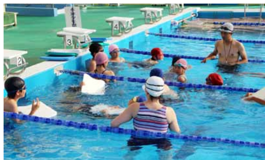
◀元気に水しぶきをあげました

に分かれて、低学年は顔つげなどの水慣れからバタ足まで、高学年は二十五mクロールや平泳ぎなどの指導を熱心に受けていました。また、七月二十二日には町内児童生徒水泳競技大会が、九月二日には管内水泳競技大会が開催されることとなっており、子ども達は大会新記録や自己記録の更