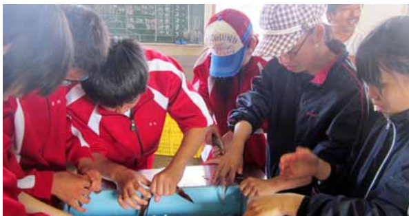
◀獲れたてのイカを捌く中学生

水揚げされ、生徒達は歓声を上げながら揚がったイカを箱詰めしていき、仕事の大変さを学びました。港に戻ってからは、イカの捌き方の指導を受け、その場で実習を行いました。また、乙部船団のご好意で分けて頂いたイカを学校に持ち帰り、イカリングやイカ飯などに調理し、乙部の海の幸を美味しく頂くこともできました。