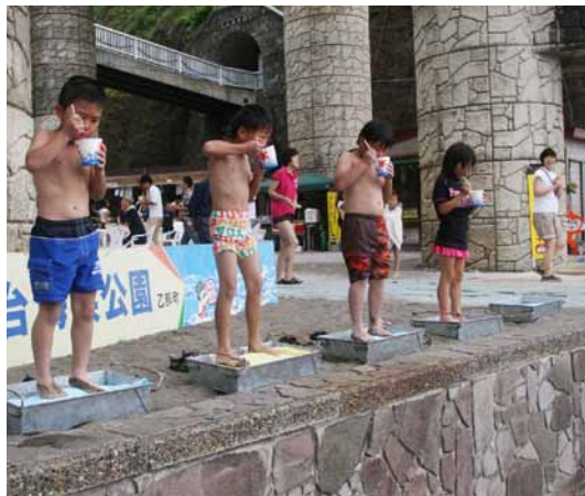
◀昨年の海のプールまつり「かき氷の早食い大会」

地元ではお盆中は何かと忙しい時期ですが、積極的にイベントに参加して、にぎやかで楽しい故郷の夏を満喫してください。