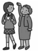
背が縮んだように感じる (実際に身長が縮んだ)