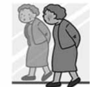
背中や腰が曲がったように感じる