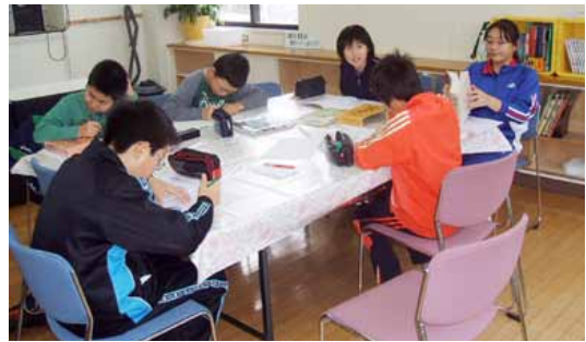
▶課題プリントに取り組む小学生