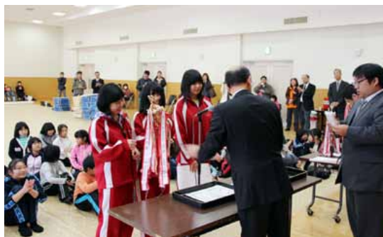
中学生の部 優勝チーム