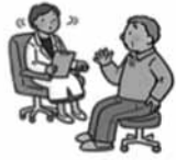
腰の痛みが、レントゲン 検査では椎間板や脊柱管 に異常がない