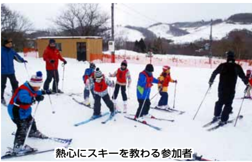
熱心にスキーを教わる参加者

一月八日から十六日まで、富岡スキー場において冬休みスキー教室が開催され、町内の小学生六十一名が受講し、スキー場はにぎわいをみせています。 スキー指導には、町スキー協会・スポーツ推進委員・学校教諭が当たり、参加者は熱心にスキーを教わっていました。スキー教室はクラス別に実施され、