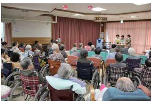
懐かしそうに聞き入るおとべ荘の皆さん