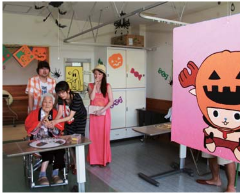
▷家族に手伝ってもらいながら、的当てなどのゲームに挑戦しました。