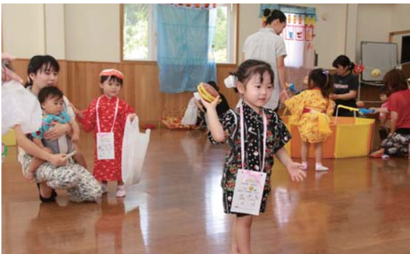
▷浴衣でゲームを楽しみました

また、かき氷やスイカのサーブスもあって、子どもたちは大喜び。最後には「大きなカブ」の寸劇も行われ、親子一緒に小さな夏祭りを満喫していました。