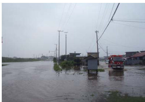
来拜川からあふれ出た水と、雨水の排水が間に合わずに、町道突符川沿道路が冠水しました。(18日14時50分ころ)

鳥山地区の一部世帯では、送水管が被害を受け、午後三時すぎから断水になりました。町では、給水車を運行し、復旧に努めたところ午後九時三十分までに断水が解消しました。