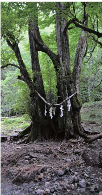
◁縁桂の周囲の土が流れ、根の一部がむき出しになり、ほころと橋が跡形もなく流されました。

縁桂自体は、周りの土がえぐりとられ、根の一部がむき出しの状態になっていましたが、八月二十六日には「大きな傷跡はなく致命的ではない」との樹木医の診断をうけ、二十九日には、土を被せたり土のうや石で川の流れを縁桂から少し離したりする処置をしました。