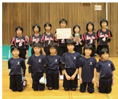
乙部バレーボール少年団