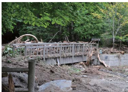
▽縁桂へ向かう遊歩道の入り口付近まで、上流でなぎ倒された木や、流された橋の破片などが押し寄せました。

遊歩道の常時開放の時期は今のところ未定ですが、今後は、治山工事を行うための作業道を今年度中に開設し、安全面を優先してイベントなどでの利用を検討しているところです。