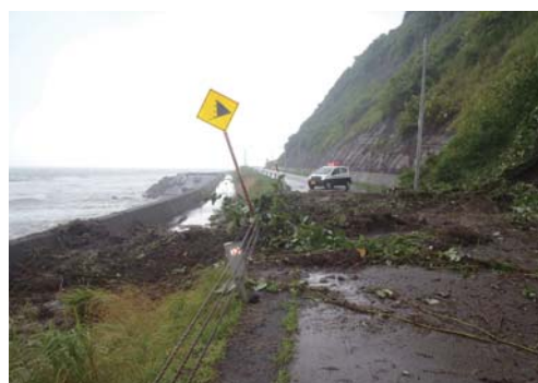
海のプールと可笑内を結ぶ町道元和1号線では、道路横の法面が崩壊し、土砂が道路に流入しました。