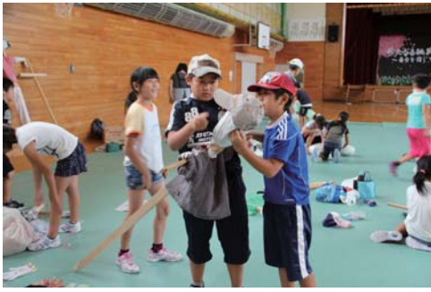
熱心にかかしを作る子ども達

八月二十九日、姫川ふれあい体験交流館において、水土里の会主催のかかし作り教室が開催され、乙部小学校の四年生二十四名が参加しました。この教室は、乙部小学校で実施している田植体験学習で田んぼに植えた稲を守るかかしを作るために開催され、自分達の着古した服や角材などを材料にしたかかし作りを通して、稲作文化を学んでいるよ