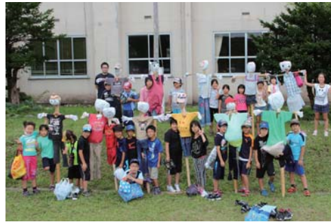
自分達で作ったかかしと一緒に

うでした。完成した十二体のかかしの内、九体は田植え体験学習を行った姫川の田んぼに、残りの三体は学校の田んぼに、植えた稲を大事に守ってくれるようにと願いを込めながら設置していました。稲は順調に成長しており、稲の収穫体験も行います。子ども達はかかし作りを通して、実りの秋を楽しみにしていました。