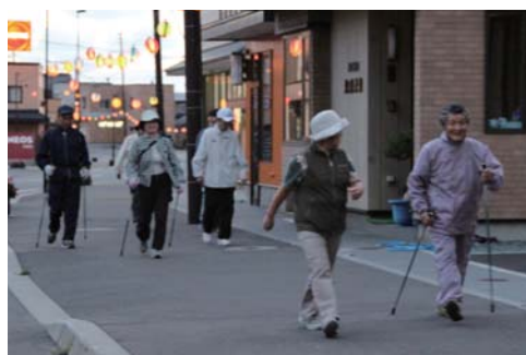
9月のウォーキング講座

は汗物を用意します。雨天時も体育館内で開催しますので、健康・体力づくりに皆さまのご参加をお待ちしています。