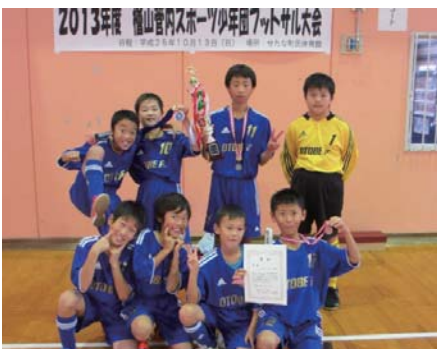
▲優勝に喜ぶサッカー少年団の選手