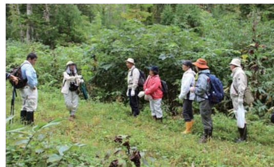
秋の植物についての説明を聞く参加者