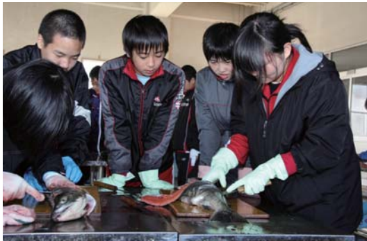
▶三枚おろしに挑戦