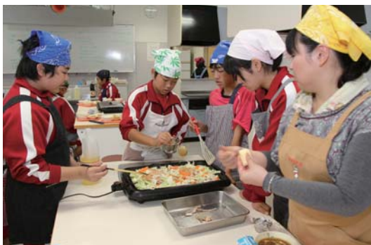
▶チャンチャン焼きに挑戦

乙部中学校二年生三十五人が十月二日、乙部船団とひやま漁業協同組合の協力を受け、漁業体験学習としてサケの定置網漁と、獲ったサケの調理を体験し、地元産業への理解を深めました。 生徒たちは、乙部漁港から三艘の漁船に分乗し、定置網が仕掛けられたポイントへ向けて出港。 設置された網をたぐり寄せると、銀色に光るサケが姿をあらわし、水しぶきをあげて飛び跳ねている様子に、生徒たちは大興奮でした。