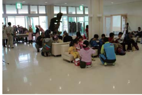
ゴールしてから豚汁を味わいました

かれて、豊かな自然の景色を楽しみながら思い思いのペースで歩きました。途中、風が強く吹く箇所がありました。風にも負けずゴールすることができました。また、昼食では日本赤十字社から寄贈された災害用炊き出し釜を活用し、炊き出し訓練を兼ねて、食生活改善推進委員会の皆さんによる豚汁を味わい、体をいたわっているようでした。