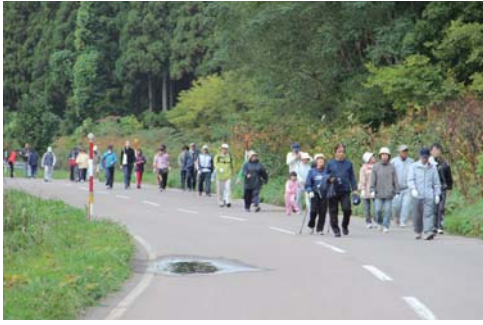
自然の景色を楽しみながら歩く参加者

十月十二日、第二十四回町民歩け歩け大会が開催され、八十歳代のお年寄りから幼児までの参加者が爽やかな汗を流し健康作りを実践しました。当日は、心配されていた雨も上がり、スポーツインストラクターからストレッチや歩き方のポイントの手ほどきを受けた後、町民体育館前を出発し姫川面へ約5kmから9kmまでの距離別の三コースに分