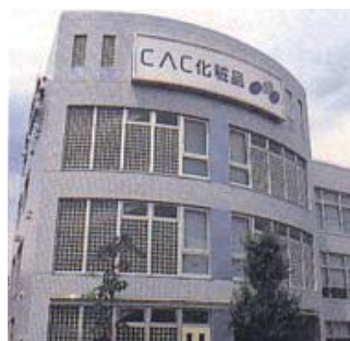
株式会社CAC (千葉県流山市)

株式会社CACが、昭和五十四年に操業を開始、昭和六十三年に町内館浦に工場を開設し、このたび工場の完成二十五周年を記念して、今日迄多くの地域住民に支えられてきたことに感謝し、乙部町の一層の振興発展を願い、多額の現金を寄附され、町政の推進に大きく寄与し、その功績は誠に大であります。