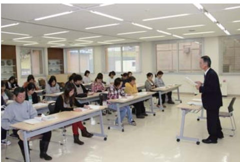
就学時健診で講話を聞く保護者