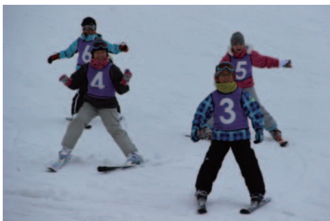
小学生でスキー場は大にぎわい

皆さまのご利用をお待ちしています。リフト運行時間は広報おとべ一月号をご覧ください。