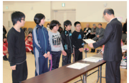
小学生の部で優勝した明和魂チーム