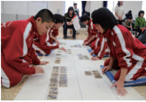
カルタ大会では熱戦が繰り広げられました

一月十一日、お正月の風物詩、第二十五回乙部町少年少女かるた大会が町民会館において開催され、町内の小学生十九チーム八十七名がジュニアの部（小学三年生以下）、小学生の部、中学生の部に分かれて熱戦を繰り広げました。試合では、選手たちは集中力を研ぎ澄まし、読み札が読まれると「はいっ」と木札を取る元気の良い声が会場に上