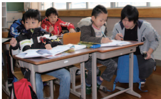
学生ボランティアに学習を見てもらう児童