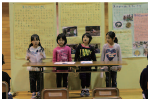
低学年「おとべでとれる作物」の発表

一・二年生は大豆の種類や栽培などについて調べ、大豆を使った調理実習について発表し、三・四年生は農業体験学習や地元で取れるハチミツについて調べたことを発表し