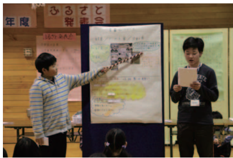
調べたことを熱心に発表する高学年

また、五・六年生は鳥山の海岸に外国などからごみが漂着していることに気付き海洋ごみについて調べ、日本だけではなく世界中の海がどんな汚れているので、皆さんこの現状を知り、自然を守って欲しいと発表し、来場者は児童のしっかりとした発表に感心していました。