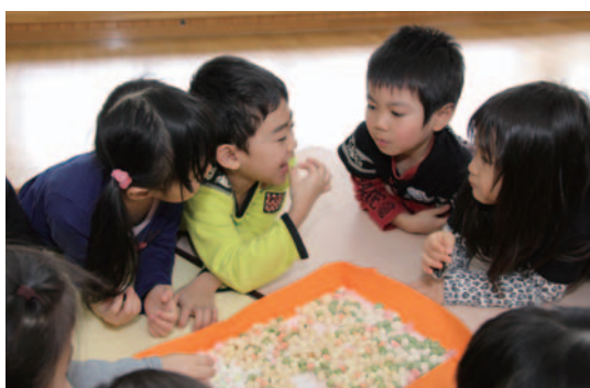
▶甘い雛あられを食べました

保育園では、ひな祭りに先立って、男の子と女の子が内裏雛に扮装して記念撮影を行いました。