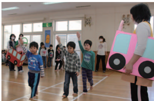
◀手をあげて横断する練習をしました

園内に手作りの横断歩道と信号、自動車を用意して、実際の道路さながらに、左右を確認して手を上げて横断歩道を渡っていました。