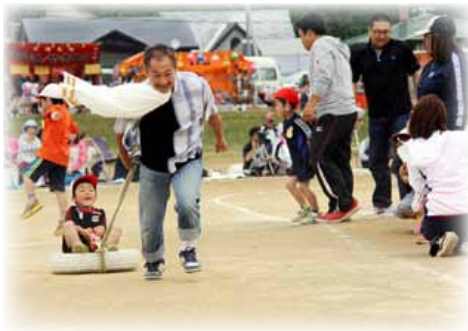
スーパーパパとちびっこマン

当日は、風が強い中ではありましたが、子どもたちは、この日のために先生や仲間たちと一生懸命練習した成果をお父さんやお母さん家族みんなにお披露目していました。