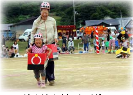
ビュンビュン！トッキュウジャー