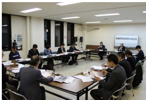
プロジェクト会議の様子

一プロブレムと呼ばれる、子どもが小学校入学後に落ち着きがなく、学校生活に馴染めないといった問題を防ぐためにも、幼児と小学校教育の繋がりを支援することが求められます。今後、この手引きを就学時健診で保護者を対象にした親学講座や各小学校で実施している一日体験入学、入学説明会などで活用し、より良い教育環境を推進します。