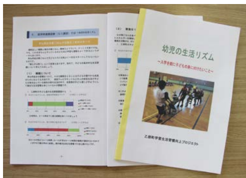
冊子「幼児の生活リズム」

幼児期は幼児の発達特性に目を向け、集団生活への適応力を身につけることで幼児が自分で課題を乗り越える力を育成することが大切です。小