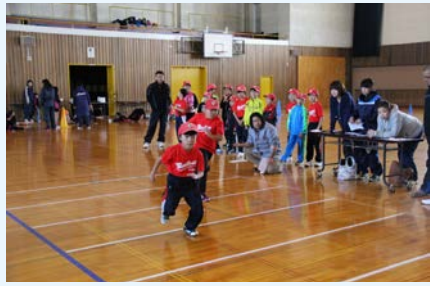
少年団合同の体力測定会

町内には6種目のスポーツ少年団が結成され、体育館や町民グラウンドなどで日々の練習に励み、各種大会では全道大会に出場するなど好成績を収めています。スポーツ少年団では、子ども達の健全な育成に力を入れ、新入団員を募集します。募集する少年団は下記のとおりで、後日、募集チラシを発行します。