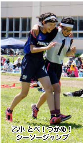
乙小 とべ！つかめ！ シーソージャンプ