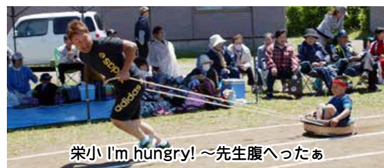
栄小 I'm hungry! ~先生腹へったあ