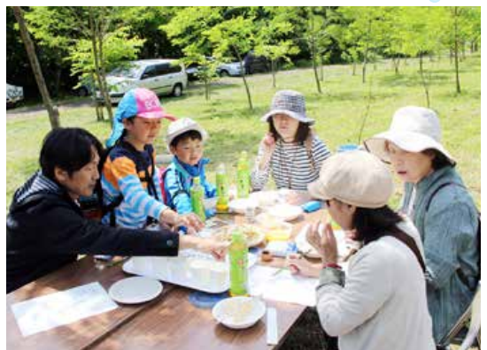
口々に話していました。