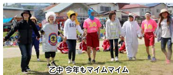
乙中 今年もマイムマイム