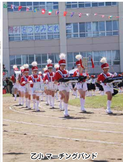
乙小 マーチングバンド