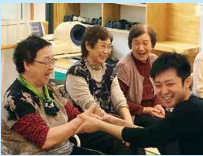
お達者いきいき教室レクリエーション