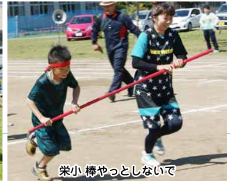
栄小 棒やっとなしないで