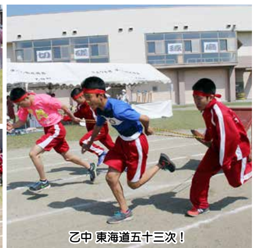
乙中 東海道五十三次！