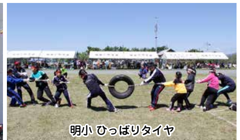
明小 ひっぱりタイヤ