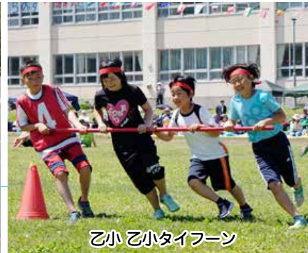
乙小 乙小タイフーン