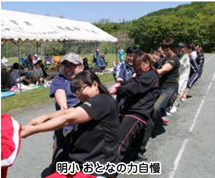
明小 おとなの力自慢