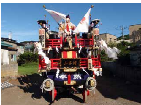
▶緑町二自治会 蛭子山