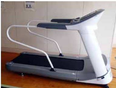
ランニングマシン（上）とマルチジム（下）

トレーニング室は町民体育館の開館日に高校生以上は無料で利用することができます。町民皆さまのご利用をお待ちしています。