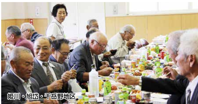
姫川・旭岱・千岳野地区