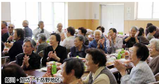
姫川・旭岱・千岳野地区