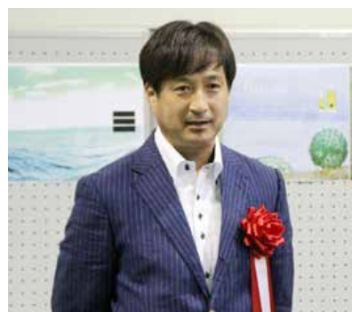
挨拶をする白井社長