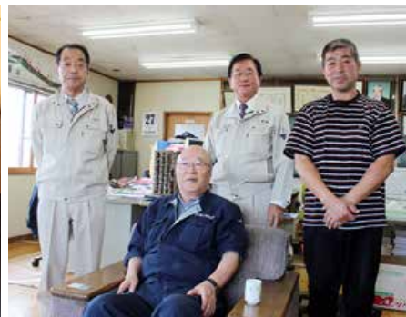
▲羅臼海産(株)(羅臼町)