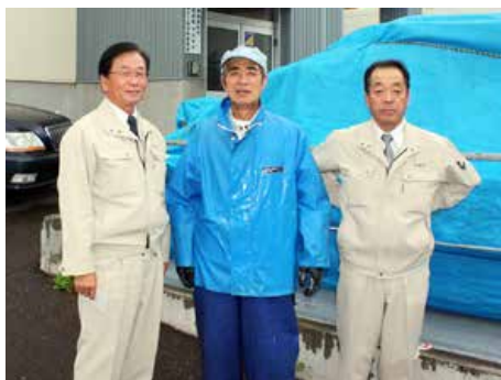
▲(株)マルキチ(網走市)