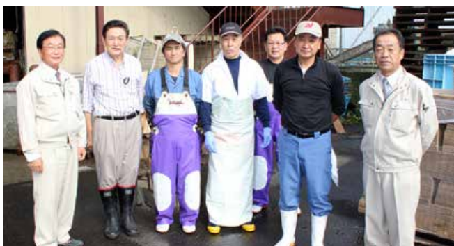
▲(株)旭正海産(羅臼町)