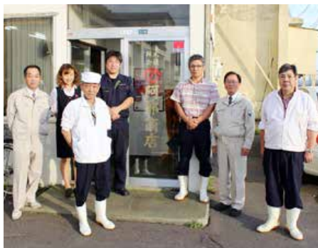
▲(株)阿部商店(釧路市)