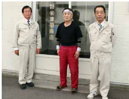
▲(株)津田商店(別海町)