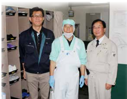
▲北見食品工業(株)(網走市)