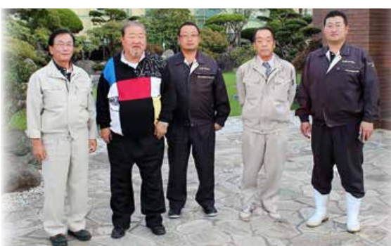
▲(株)笹谷商店(釧路市)