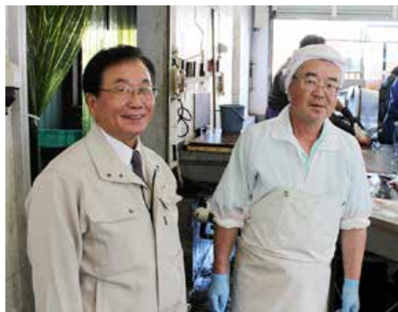
▲(株)野尻正武商店(斜里町)