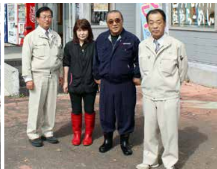
▲(有)島田商店(標津町)