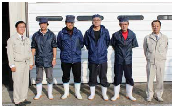
▲マルヒ水産(株)(斜里町)