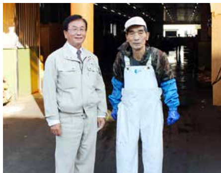
▲(株)丸中しれとこ食品(斜里町)