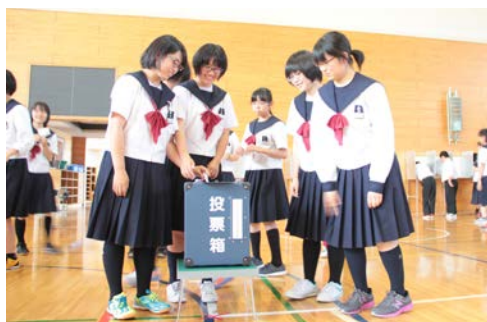
▲本物の投票箱に票を入れる乙中生徒

当日は町選挙管理委員会の協力で、実際に選挙で使用する投票箱や記載台を体育館に配置し、中学生たちは真剣な面持ちで投票用紙に記入し、