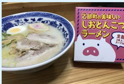
地域おこし協力隊

季節の変わり目で、これからどんどん気温が下がり、寒くなっていくと思いますので、皆様もどうかお身体に気を付けてお過ごし下さい。