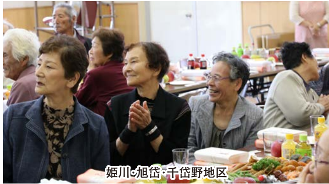
姫川・旭岱・千岱野地区