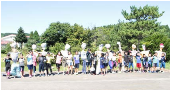
▲おもいよみの発想で出来上がった、個性的なカカシ