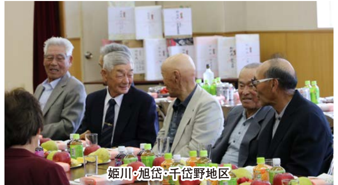
姫川・旭岱・千岱野地区