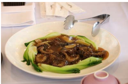
▲乙部町産のナマコと黒千石大豆を使用

普段見慣れた食材が様々な料理へと変わって登場し、参加者は驚きながらも口々に感想を言い合い、地域の特産品を堪能しました。