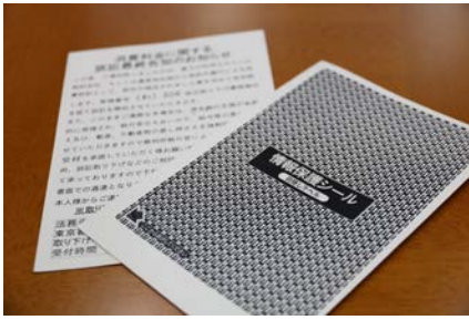
▲情報保護シールを付けるなど手口が巧妙化

他にも、訪問販売などの悪質商法が行われていたとの話もあって、決して他人事ではないかもしれない事態となっており、町や警察でも様々な場面で注意を呼びかけています。