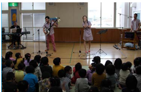
▲つくし保育園でのコンサート

象に全道各地を巡回して公演を実施する「文化の宅配便事業」として実現したものです。「エゾン」は民謡をポップな曲にアレンジし、お爺ちゃん、お婆ちゃんからお孫さんまで、幅広い年代が楽しめるコンサートで有名です。