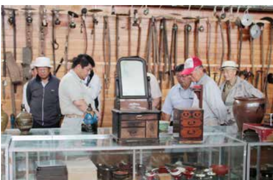
▲移転が完了した文化財保存センターも見学しました

町内には様々な石碑が残され、昔の歴史を今に伝えていきます。千岱野の「名馬越之浦の碑」や「獣魂碑」は乙部の農業の先駆けを。栄浜・元和にはニシンに代わる生活の糧を稲作に求め、水田開墾に取り組んだ物語が。元和の40歳の高台からは、幅約3.6メートルの生活道路を地元有志が出資し開削。また、悲惨な山津波の犠牲者の冥福を祈る、慰霊碑など。これら十二か所の石碑を訪ね、理解を深めようと七月二十二日、公民館郷土講座バス見学学習『町内の石碑』が開催され、町文化財調査委員ら七人が参加。町学芸員の説明で、故郷の歴史を探訪しました。