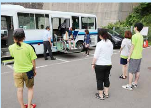
▲バリアフリーモニターツアー参加者をお迎え