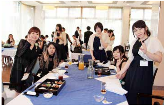
▲交歓会でビンゴゲーム

め、強い意思と決意をもって人生を切り拓いていきます」と誓いの言葉を述べました。式典に先立って行われた母校訪問では、中学時代を懐かしむように教室の机やイスの感触を確かめていました。また、交歓会ではビンゴゲームなどをしながら、友人との久しぶりの再会を喜び、近況報告をしたり、将来の夢について語り合う姿が見られました。