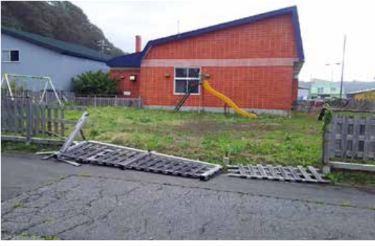
▲倒壊したみさき保育園の木塀

九月四日夜から五日未明にかけて北海道に最接近した台風21号は、各地で大きな被害を及ぼし、特に関西国際空港が閉鎖するなど、国内外に大きな衝撃をもたらしました。乙部町では、災害に備えて四日午後四時に災害対策本部を設置。