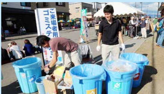
▲産業まつりのゴミ分別

祭りが終わり、提灯も撤去した翌日には台風が来て、提灯を早く撤去して良かったと思っただけで、その後は震度7の大地震が胆振東部を襲い、道内全域が停電となり、乙部町全域の復旧には、約二日かかりました。仮に復旧が大幅に遅れていたとなると、乙部町の高