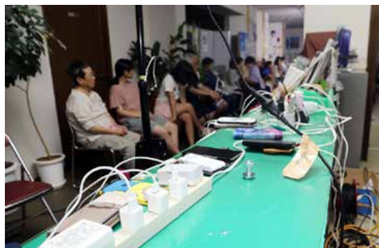
▲のべ120名が携帯電話の充電を利用

広報おとべ九月号でもお知らせしました非常持出袋と懐中電灯・携帯ラジオは、自治会町内会連合会での配布を十