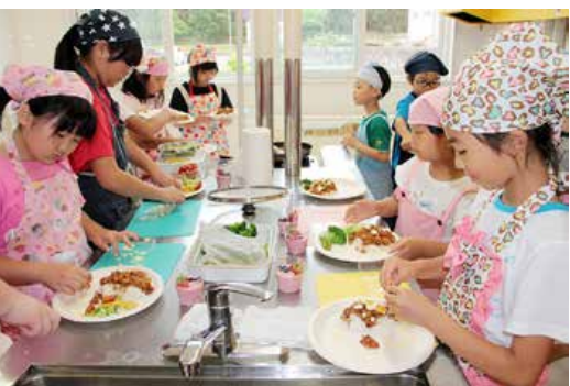
▲ようやくプレートに盛り付けです

作料理が四品。参加した十九人は四つのチームに分かれ、野菜の切り方などはチーム内でアイデアを出し合い、レシピを読み解きながら奮闘すること約三時間半。ご飯をプレートに盛り、タコスをかけてとメイン料理の完成です。それにサラダを添え、ドレッシングをかけ、じゃがいものスープとハスカップのムースを並べると、まるでレストランで出される料理のようでした。