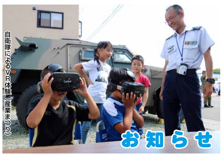
自衛隊によるVR体験（産業まつり）