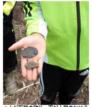
▲上が石器の破片、下が土器のかけら

とべで行われた乳児健診には三人の赤ちゃんが訪れ、ボランティアによって絵本の読み聞かせが行われ、保護者に「家でも読んであげてね」と声をかけて、めいめいに二冊の絵本がプレゼントされました。これから乳児健診がある方はどうぞお楽しみに。