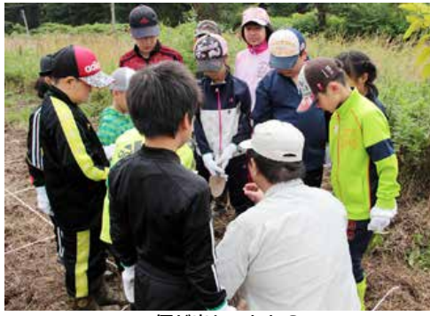
▲何が出土ののかな？

むかし、むかし、今から三千年くらい前の大むかし、乙部には縄文人が暮らしていました。その証拠を見つけてよ