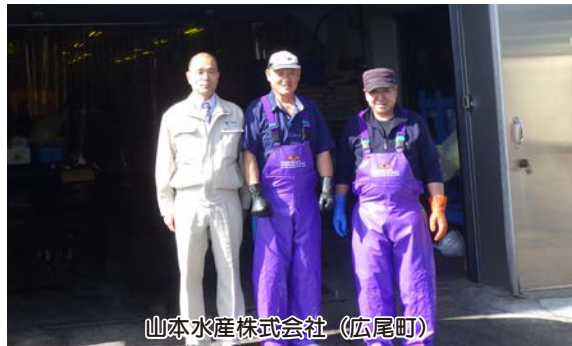
山本水産株式会社（広尾町）