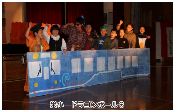
栄小 ドラゴンボールS