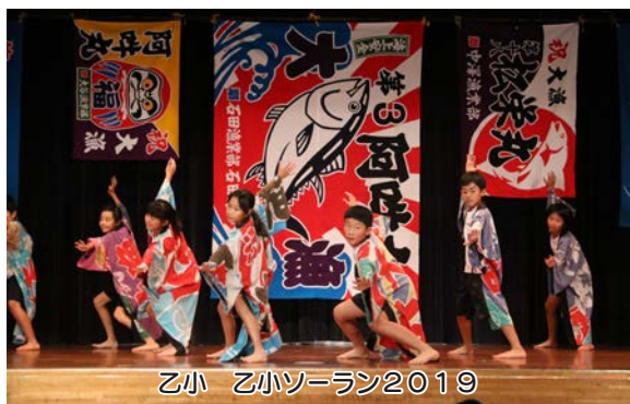
乙小 乙小ソーラン2019

見に来た方からは、一生懸命演技や演奏する子供たちに拍手や歓声が贈られ、楽しい一日を過ごしました。