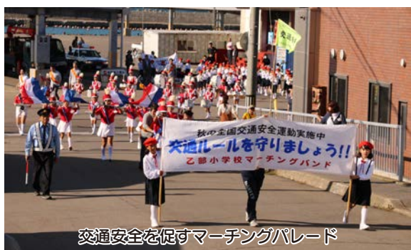
交通安全を促すマーチングパレード