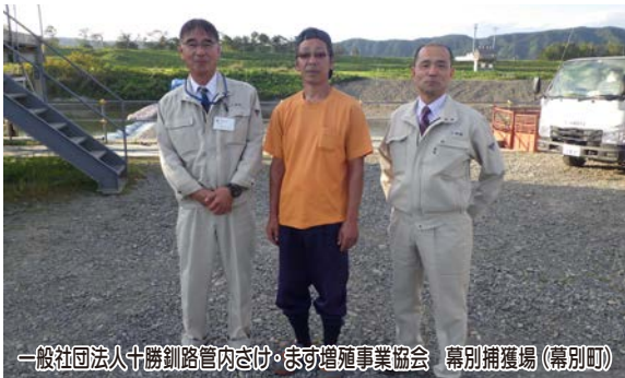
一般社団法人十勝釧路管内さけ・ます増殖事業協会 幕別捕獲場（幕別町）