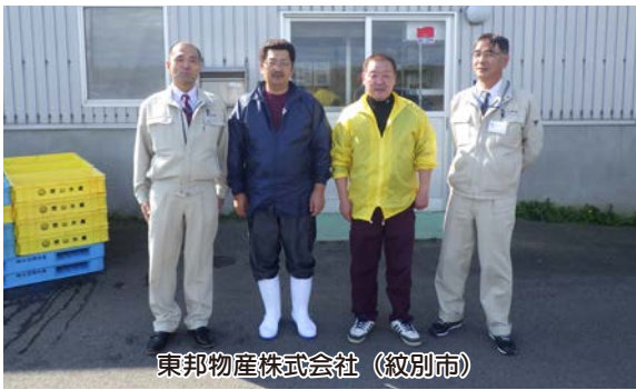
東邦物産株式会社（紋別市）