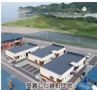
受賞した緑町団地

緑町団地は、町で抱える地域の少子高齢化や空き地問題に対して、子育て世代から高齢者世代まで安心して暮らせる住まいを目指し設計され、子育て世帯等の流入による地域高齢化の軽減・人口呼び戻しやまちなかの空き地を利用した空き地問題の解消につなげた観点が評価されました。