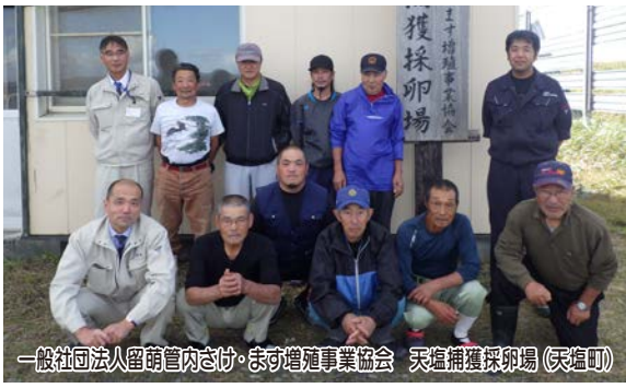
一般社団法人留萌管内さけ・ます増殖事業協会 天塩捕獲採卵場（天塩町）