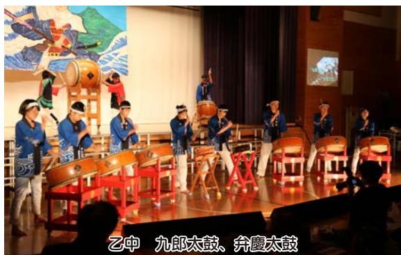
乙中 九郎太鼓、弁慶太鼓