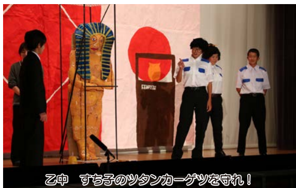
乙中 すち子のツタンカーゲツを守れ！